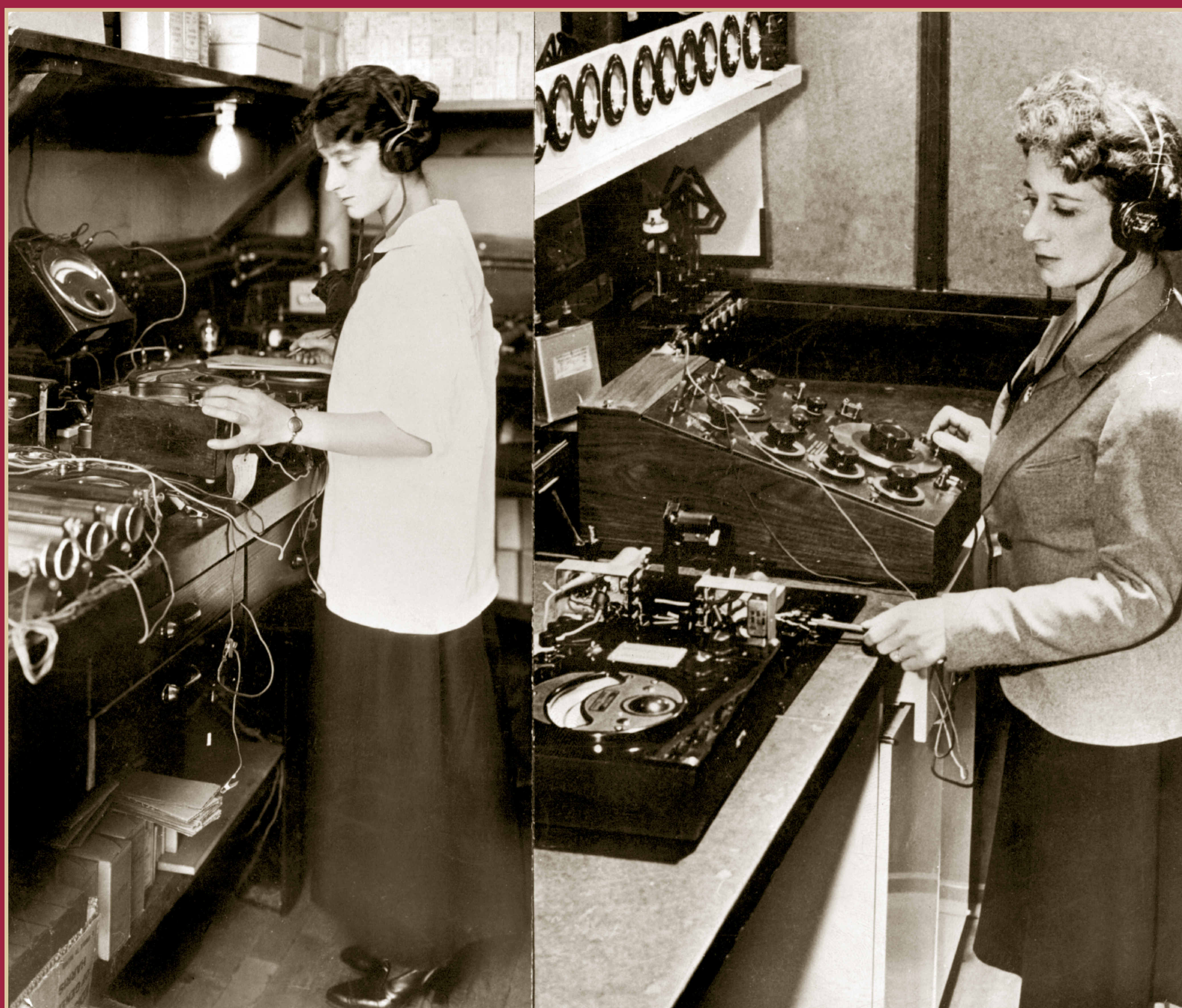
Operadoras de transmisión, ca. 1940.