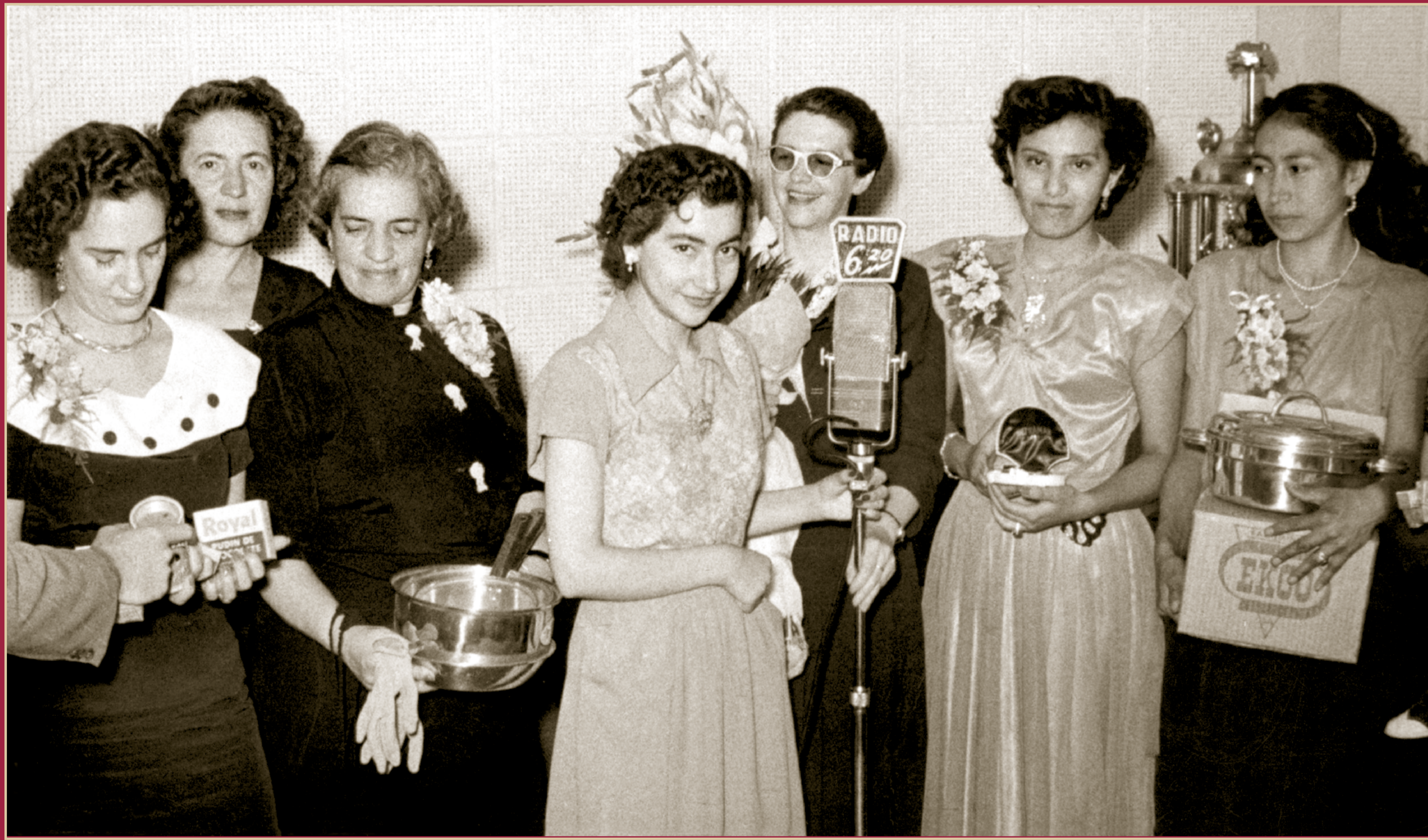
Socias del Club de Regalos de la Radio 6.20, México, 30 de noviembre de 1951.