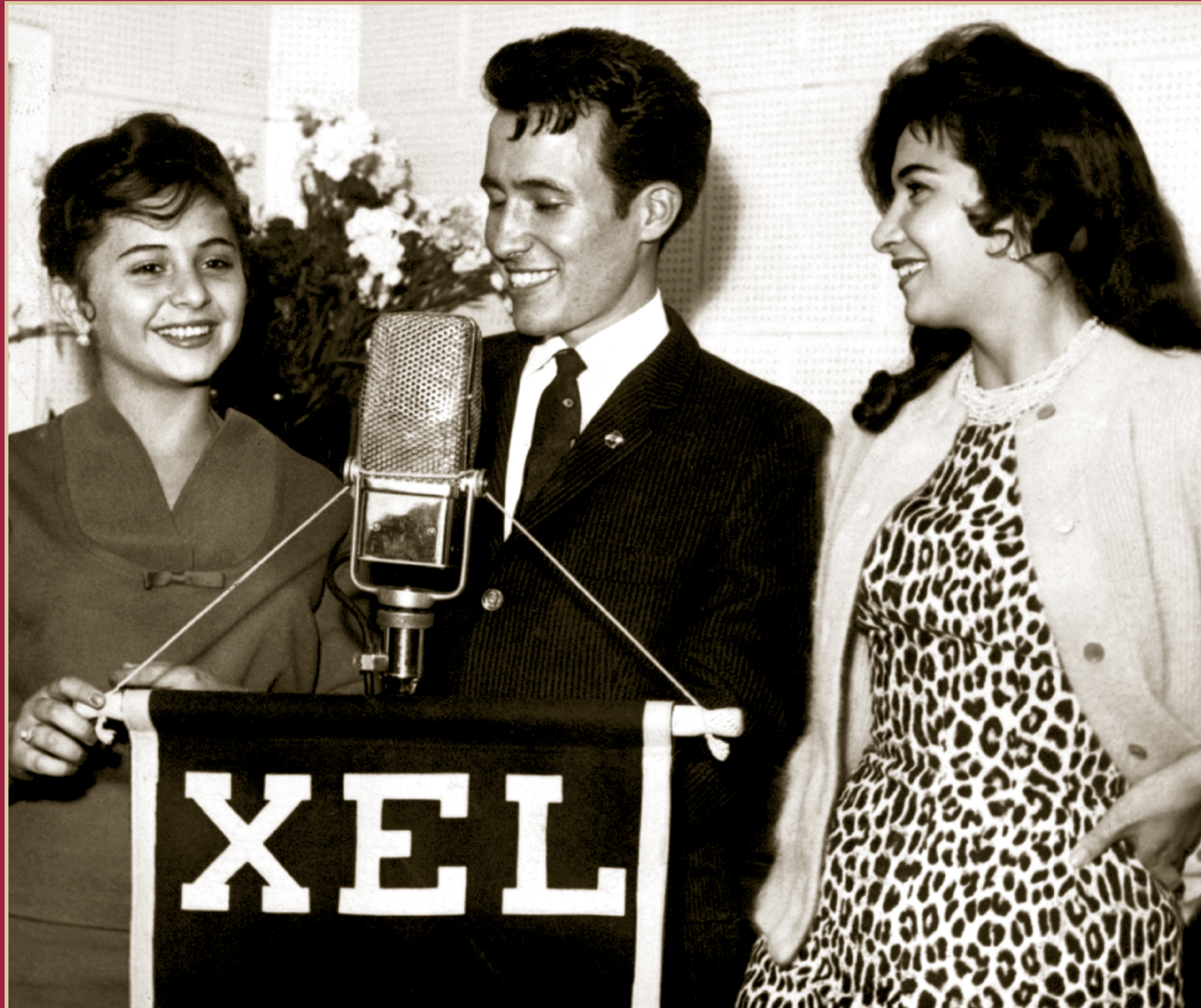
Entrevista a la actriz Titina Romay por la XEL, Radio Capital, 16 de octubre de 1960.