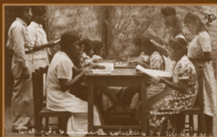
Hombres y mujeres aprendiendo a leer en el Centro de Enseñanza Colectiva No. 8, Telixtlahuaca, Oaxaca.