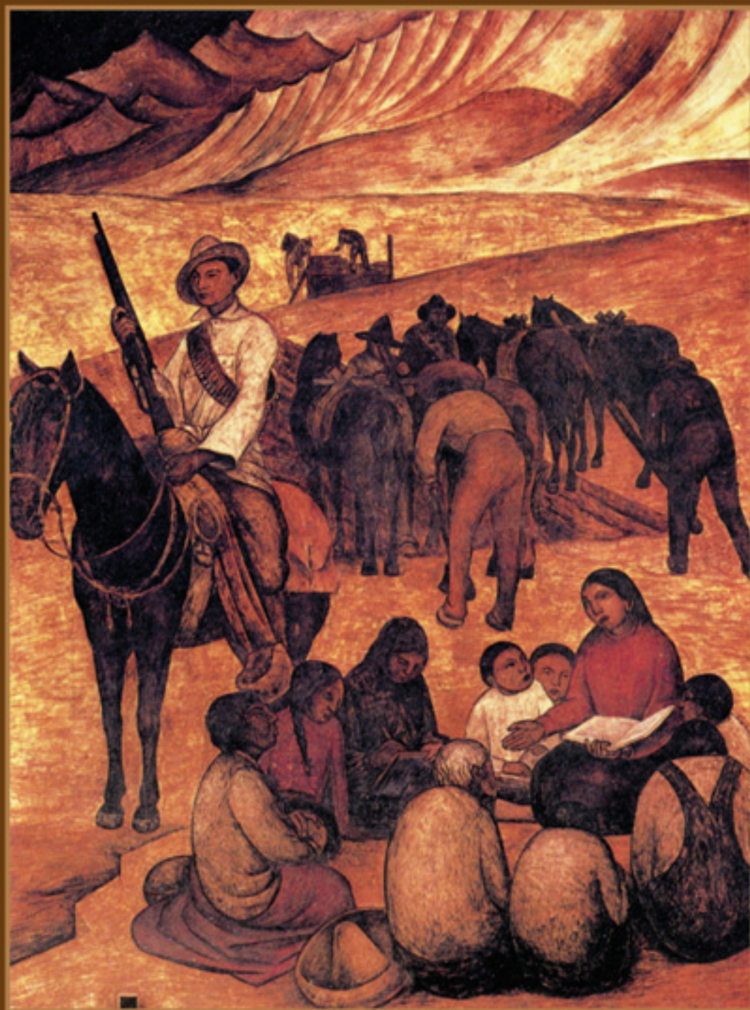
La maestra rural , Diego Rivera, SEP, 1923.

Moisés Sáenz, La integración de México por la educación , ideólogo de la escuela rural, conferencia. 1928.