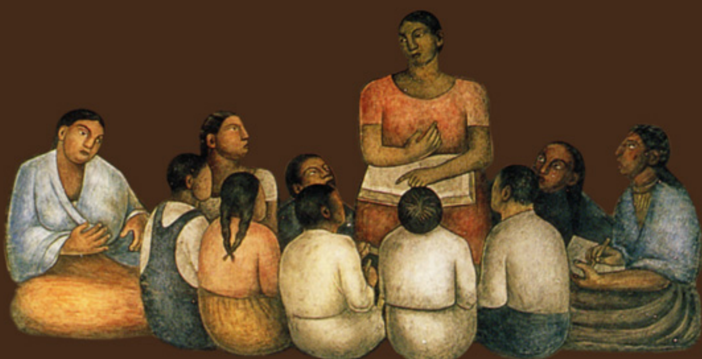
La maestra rural , Diego Rivera, 1920

La Unidad de Igualdad de Género del Instituto Nacional de Estudios Históricos de las Revoluciones de México y El Colegio de San Luis, presentan la exposición Maestras rurales del México Posrevolucionario . La investigación realizada por la Dra. Oresta López Pérez integra una muestra de fotografías realizadas entre 1920 y 1950 bajo resguardo del Archivo General de la Nación y la SEP, así como imágenes de murales e ilustraciones de destacados artistas de la época.