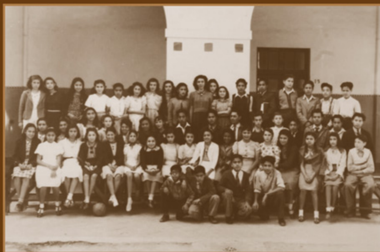
Futuros docentes y alumnos de la escuela anexa. Escuela Nacional de Maestros, AGN, Fondo Enrique Díaz, 1940.