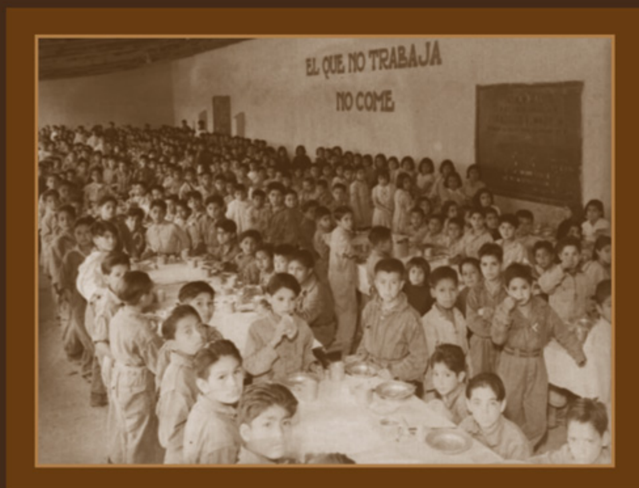
Niños y niñas en el comedor del Hospicio Escuela Francisco I. Madero. AGN, Fondo Enrique Díaz, 1939.

Tras la Revolución, muchos niños quedaron huérfanos. Ante esta situación, los gobiernos posrevolucionarios abrieron escuelas para ellos, donde además de darles techo y comida, les inculcaban el sentido del trabajo.