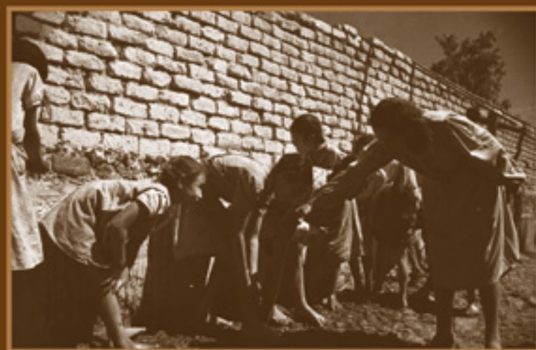
Maestra y alumnas lavando sus pies. AGN, Fondo Hermanos Mayo, 1945.