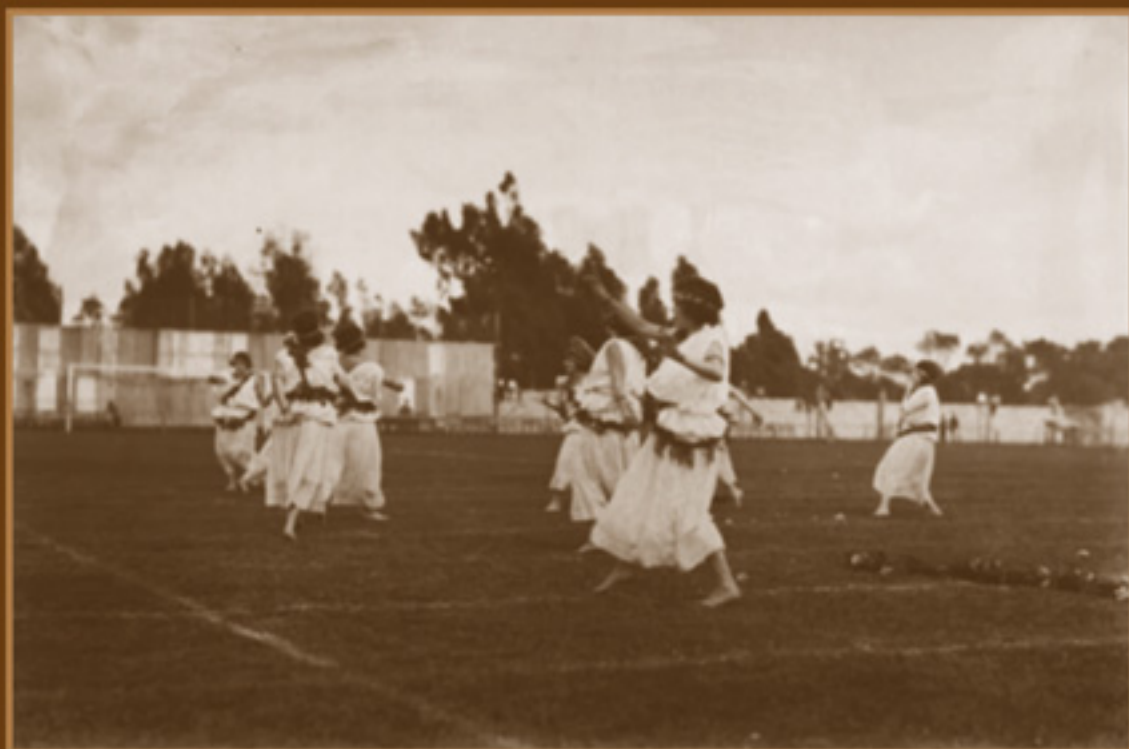
AGN, Fondo Enrique Díaz, 1930.

Las maestras de la generación de los años treinta fueron influidas por la moda estadounidense. Por primera vez tenían el cabello corto, ropas muy cómodas y bailaban y ejecutaban actividades deportivas al aire libre.