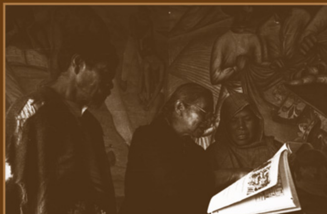
Maestra alfabetizando indígenas adultos en la Sierra, con la Cartilla de Alfabetización Nacional. AGN, Fondo Hermanos Mayo, 1945.