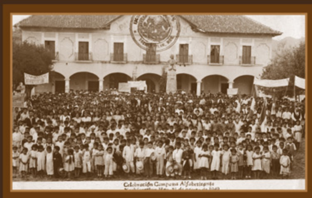
Comunidad de Xochicoatlán, Hidalgo, en la reunión de escuelas de la región para celebrar la Campaña Alfabetizante.