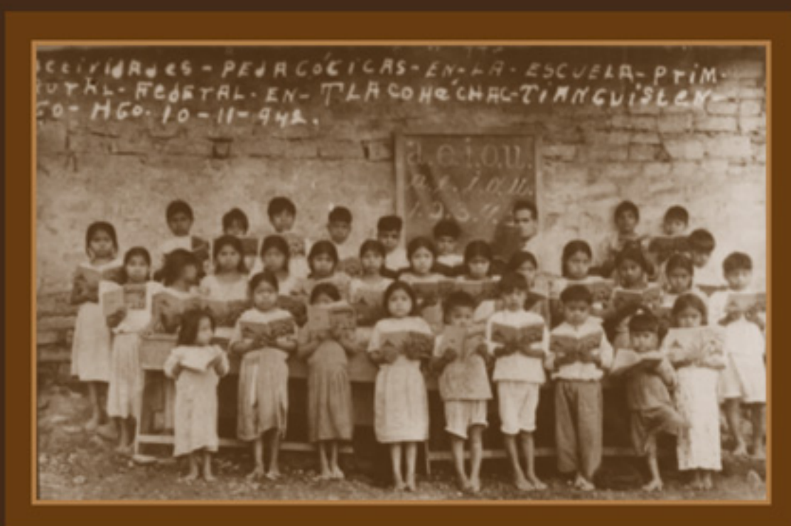
Niños y niñas indígenas con libros de texto, Actividades pedagógicas en la Escuela Primaria Rural Federal en Tlahohechac Tianguistengo, Hgo. 10-11-1942. AGN, Fondo Presidencia, Manuel Ávila Camacho] 1942.

Narciso Bassols, Secretario de Educación de Pública, 1934.