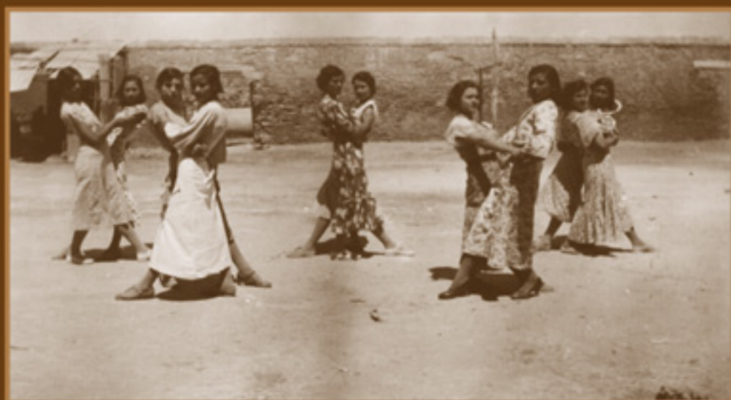
Actividades de cultura física y estética realizadas en el Instituto de Tamaulipas, AGN, Fondo Presidencia, Cárdenas, 1935.

Durante los años de la reforma educativa que implementó la Educación Socialista, las maestras rurales recibían formación en los Institutos de Orientación Socialista de la SEP.