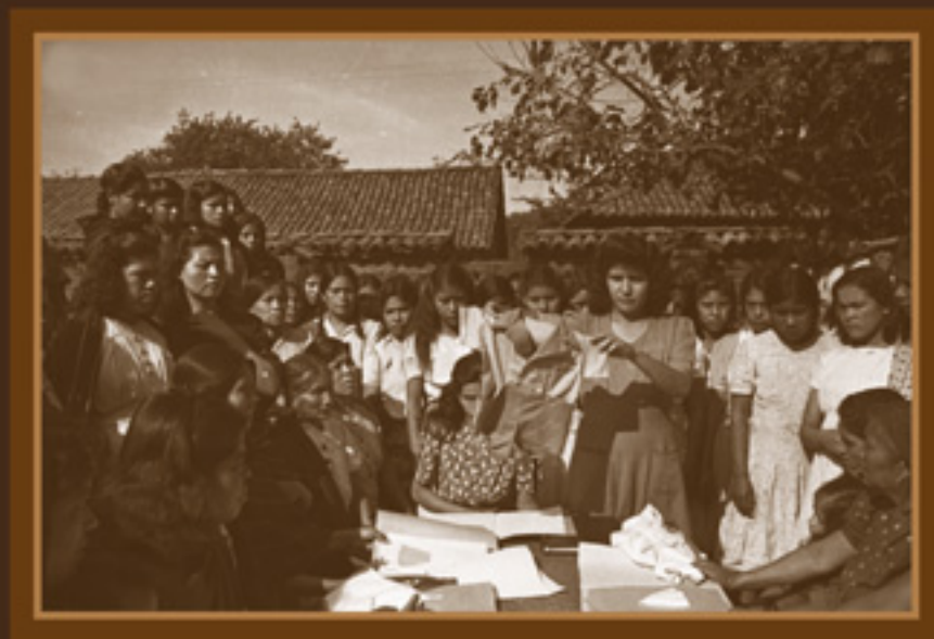
Grupo de mujeres con su maestra, mostrando los trabajos de corte y confección de la escuela. AGN, Fondo Hermanos Mayo, 1945.

Fue durante la primera mitad del siglo XX, que el magisterio mexicano se llenó de mujeres, no solo porque era una de las pocas profesiones a las que tenían acceso, sino porque miles de ellas deseaban apoyar al desarrollo del país. Esta masiva afluencia de mujeres al gremio, se expresó en una amplia y constante participación en la lucha por reivindicar los derechos políticos y sociales y también porque impulsaron luchas por la igualdad de género. Así, las maestras en 1933, lograron la equidad salarial frente a los varones; conquistaron seguridad laboral y permisos maternales como nunca antes. Sentaron precedentes con ello, para que otras trabajadoras lo logaran y también junto con mujeres de todos los sectores, crearon el Frente Único Pro-Derechos de la Mujer, desde donde lucharon por conseguir el sufragio femenino.