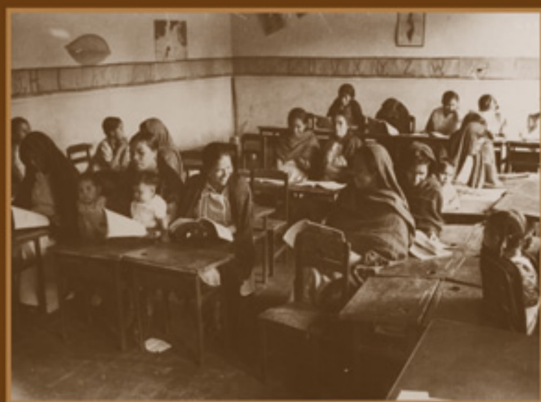
Mujeres campesinas en la clase, esperando a su maestra. AGN, Fondo Presidencia, Manuel Ávila Camacho, 1945.