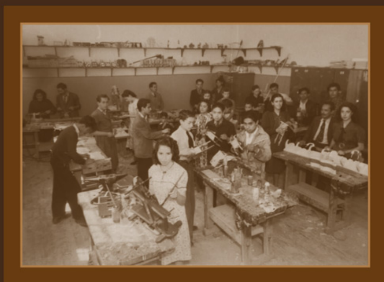
Clases mixtas de carpintería, en la Escuela Nacional de Maestros. AGN, Fondo Enrique Díaz, 1940.

Para cumplir con esta y tantas otras de las variadas tareas de que se ocupaban las maestras de inicios del siglo XX, se las instruía en materias prácticas antes negadas para ellas.