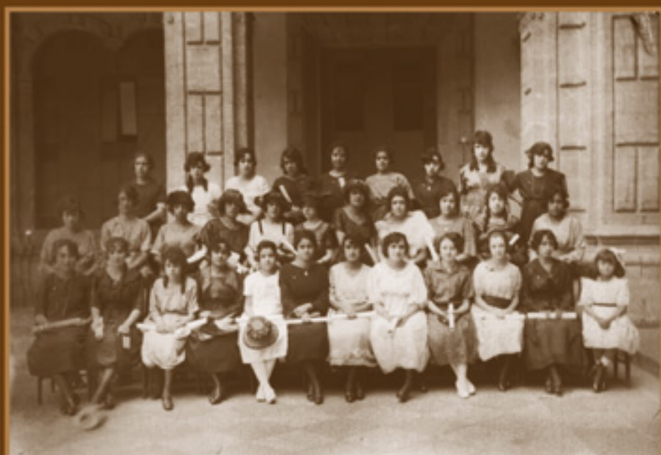
Una nueva generación de maestras. (Se desconoce el lugar y fecha).

Pese a que aún no se pacificaba el país, en la década de 1920 se hacían esfuerzos por volver a la normalidad. La foto del grupo muestra a alumnas de diversas edades que obtuvieron un diploma. Durante estos años se daban con frecuencia los casos de maestras tituladas a los 12 o 14 años de edad.