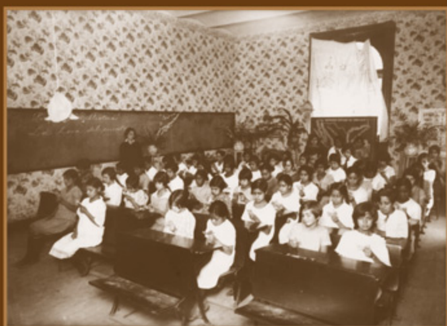
Maestra de escuela urbana mientras se leen los pequeños Cuentos de Calleja que enviaba la SEP a las escuelas. AGN, Fondo Enrique Díaz, s/f.

Las escuelas urbanas -como modelo a seguir- daban cuenta de los trabajos y lecturas que realizaban sus alumnas ataviadas con uniforme, el cabello corto y en un aula bien equipada.