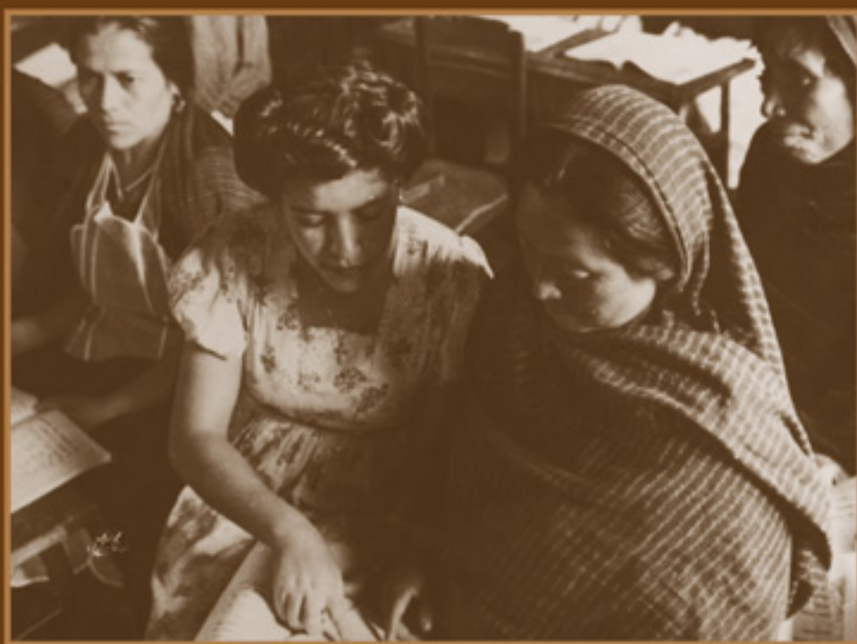
Mujeres campesinas estudiando con su maestra en la clase.