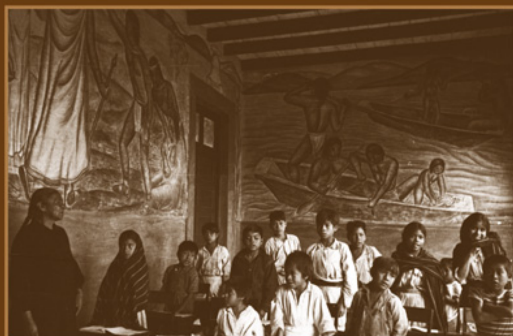
Maestra alfabetizando niños indígenas en la Sierra. AGN, Fondo Hermanos Mayo, 1945.

Las maestras, junto a sus alumnos, madres y padres de familia, inventaron un mundo nuevo a partir del trabajo agrícola, de cantos, bordados, juegos y otras actividades escolares y sociales.