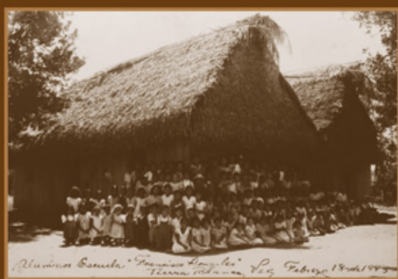
Entre la multitud estudiantil se encuentran las maestras rurales. Comunidad escolar de Tierra Blanca, Veracruz. AGN, Fondo Presidencia, Manuel Ávila Camacho, 1943.