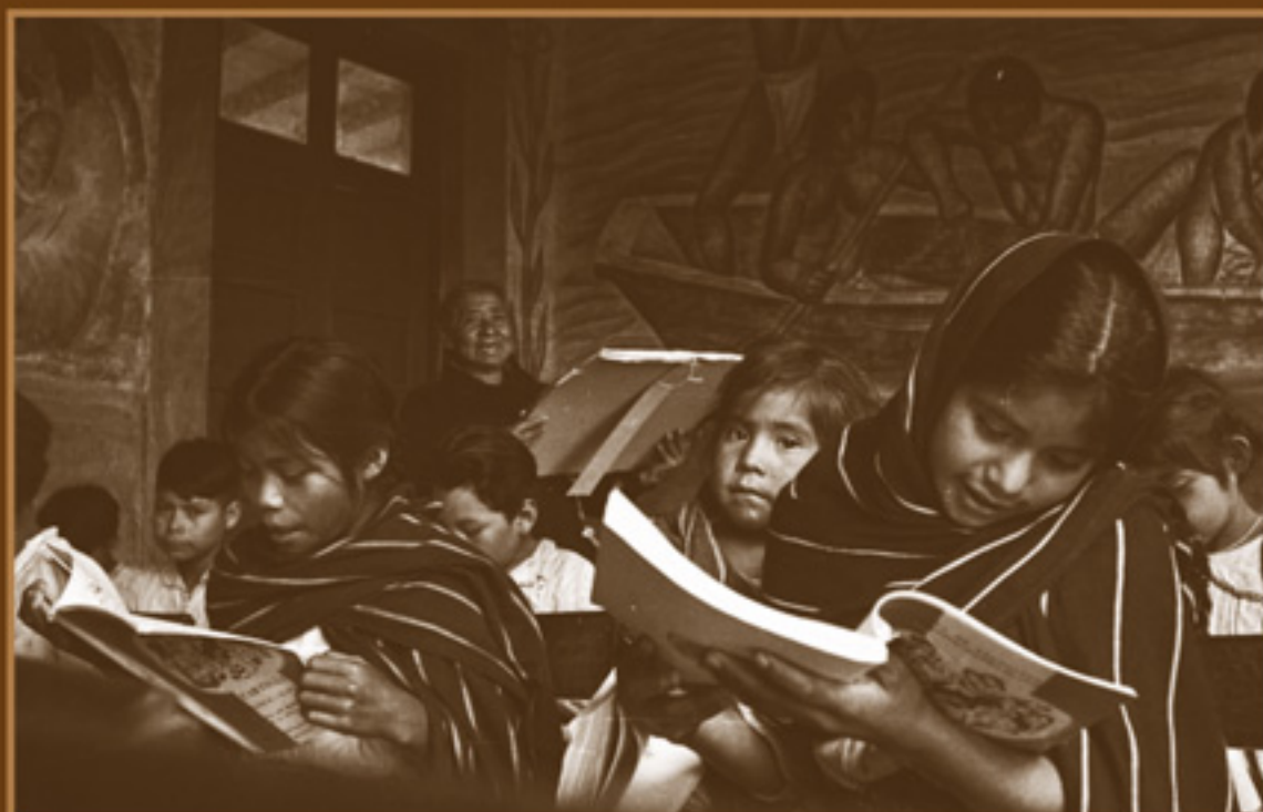
Maestra enseñando a niños indígenas en la Sierra, con la Cartilla de Alfabetización Nacional. AGN, Fondo Hermanos Mayo, 1945.

Las maestras, junto a sus alumnos, madres y padres de familia, inventaron un mundo nuevo a partir del trabajo agrícola, de cantos, bordados, juegos y otras actividades escolares y sociales.