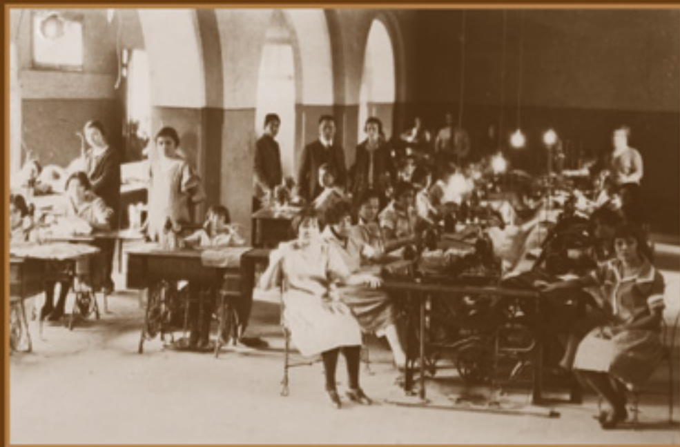
Maestras con su grupo de alumnas de la Escuela Industrial "J. Cruz Gálvez" de Hermosillo, Sonora. Pequeñas y grandes aprenden a usar las máquinas de coser. AGN, Fondo Presidencia, Obregón – Calles, 1924.