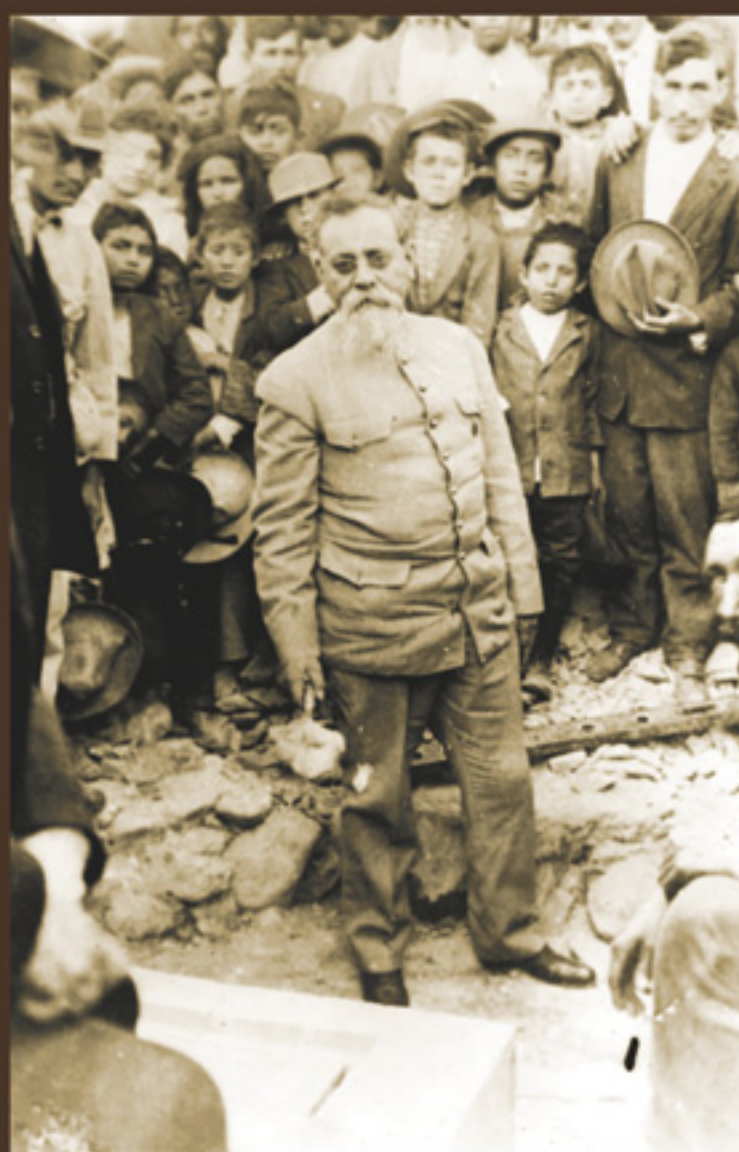
El Primer Jefe colocando la primera piedra de la Escuela Normal, Saltillo, Coah., diciembre de 1915, Fototeca Constantino Reyes Valerio, Monumentos Históricos, INAH.

Pero además de construir edificios, la Secretaría de Instrucción Pública y Bellas Artes fundó instituciones, como la escuela de Bibliotecarios y Archiveros, la primera de su tipo en el país; y la Escuela Nacional de Veterinaria, dependiente de Agricultura.