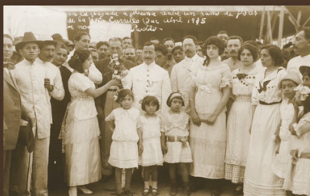
El general Salvador Alvarado y el Lic. Luis Cabrera a su llegada a Muna, Yucatán, abril de 1915