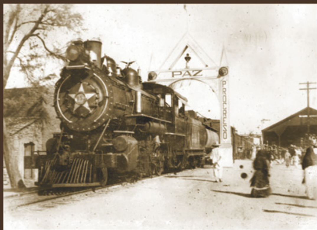
Arribo del C. Venustiano Carranza a Salamanca, Gto., febrero de 1916