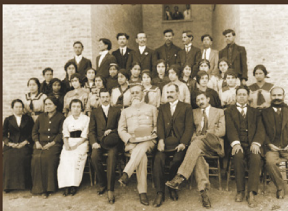
Profesores y alumnos de la Escuela Normal con el Primer Jefe, Saltillo, Coah., diciembre de 1915.