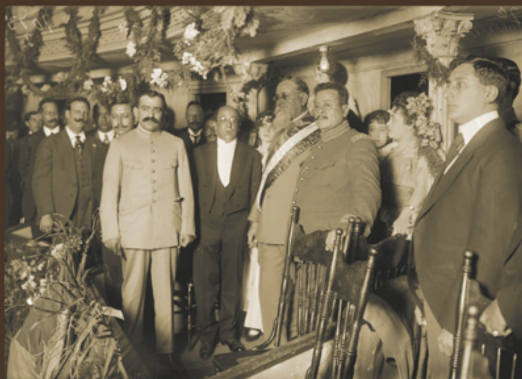
El Primer Jefe Venustiano Carranza durante un acto oficial en el Teatro Arbeu, ciudad de México, noviembre de 1916

El Congreso Constituyente al que convocaría el Primer Jefe del Ejército Constitucionalista, encargado del Poder Ejecutivo, estaría en posibilidades de aprobar, rechazar o modificar los decretos emitidos por el gobierno constitucionalista. Una vez establecidos los poderes, se podrían celebrar elecciones generales para presidente y vicepresidente de la República.