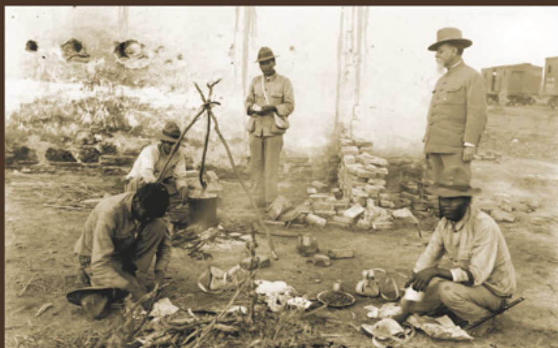
El Primer Jefe recorre el campamento de su escolta, Hermosillo, Son., septiembre de 1913, Fototeca Constantino Reyes Valerio, Monumentos Históricos, INAH.

El objetivo del gobierno pre-constitucional fue dar a las fuerzas armadas un rostro distinto al del Ejército porfirista disuelto por los Tratados de Teoloyucan. Se pensaba en un ejército para la paz, que por su espíritu y su eficiencia se convirtiera en el guardián de la integridad nacional y el más firme sostén de la autoridad emanada del pueblo.