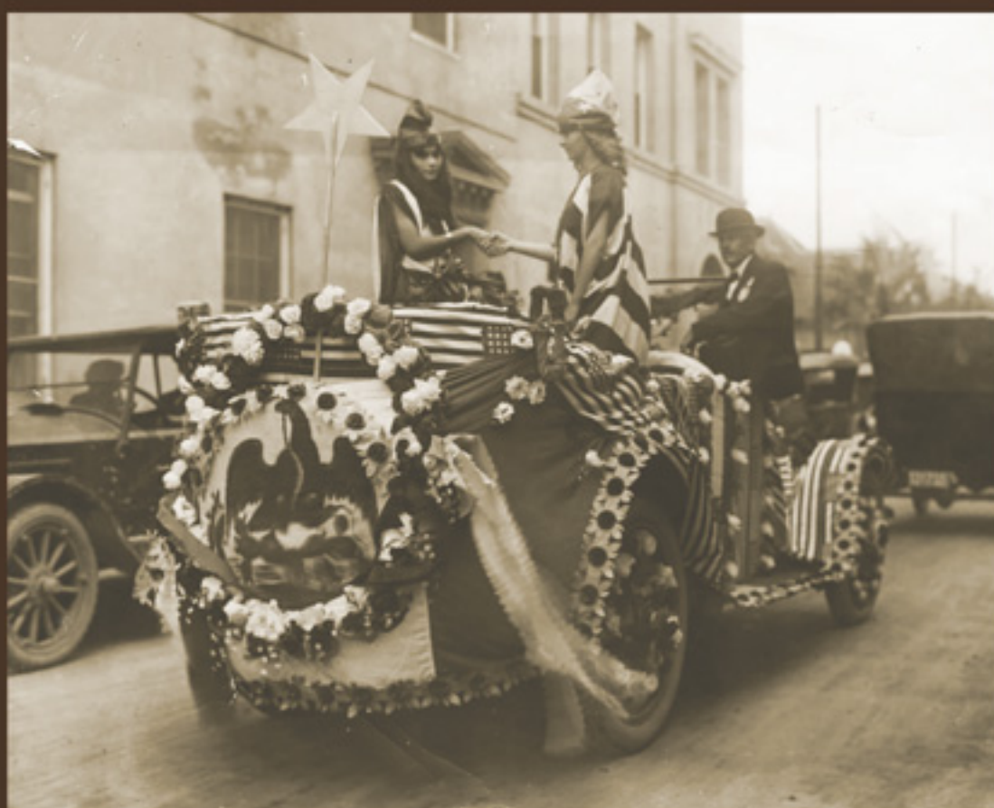
Carro alegórico que representa la unión entre México y los Estados Unidos. ca. 1916, Fondo Washington, Acervo Histórico Diplomático, Secretaría de Relaciones Exteriores.

Asimismo el vicecónsul noruego informó que su gobierno iría por el mismo camino, al igual que la joven Turquía, cuyo representante argumentó que el Imperio Otomano: “jamás deja de corresponder, como se merecen, a los Gobiernos que dan amplias Garantías a sus súbditos”.