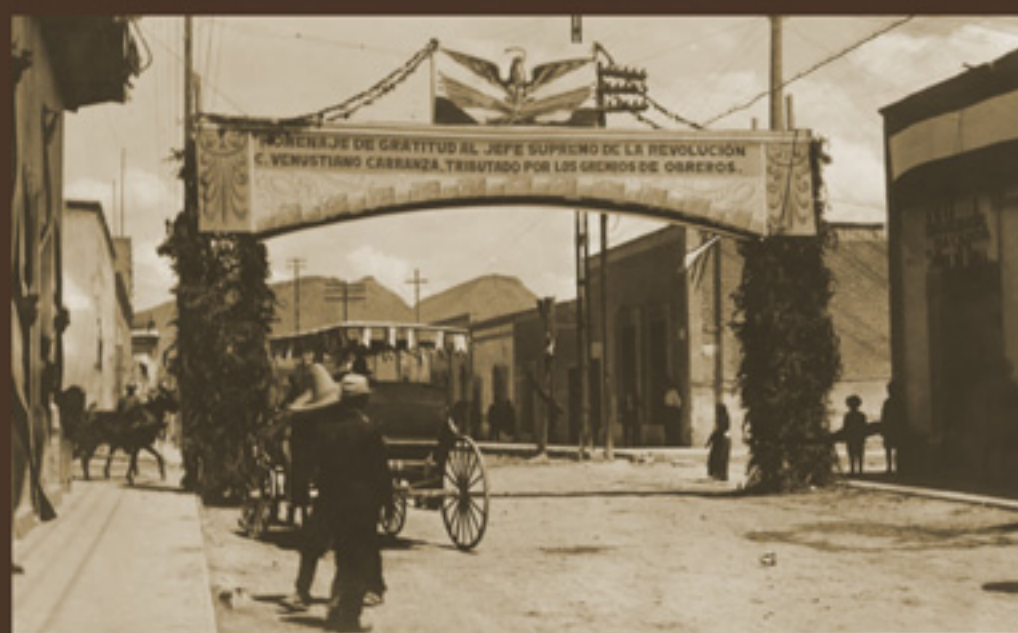
Arco triunfal en honor del C. Venustiano Carranza, lugar no identificado, ca. 1915

Venustiano Carranza, Hermosillo, Son., 24 de septiembre de 1913.