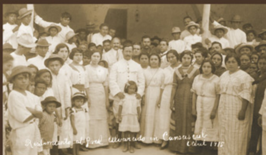
Recibimiento del Gral. Alvarado en Cansascub, Yuc., abril de 1915

En lo colectivo, las mujeres se reunieron en la ciudad de Mérida en enero de 1916 para celebrar el Primer Congreso Feminista que organizó el general constitucionalista Salvador Alvarado. Ahí expresaron por primera vez sus inquietudes en torno a su participación política, exigieron cultura y educación, así como igualdad completa con los derechos del hombre.