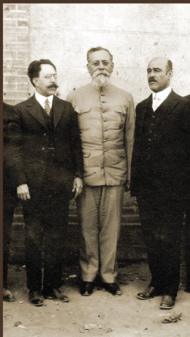
El Lic. Luis Cabrera, Venustiano Carranza y el Ing. Ignacio Bonillas. ca. 1916

En el ámbito político, Carranza lanzó un Decreto sobre la sucesión del Poder Ejecutivo; a su juicio el desarrollo de la nación debía procurarse dentro de un régimen de civismo. "Es pues preciso, ya que han terminado las causas que originaron el régimen revolucionario militar, que termine éste también."