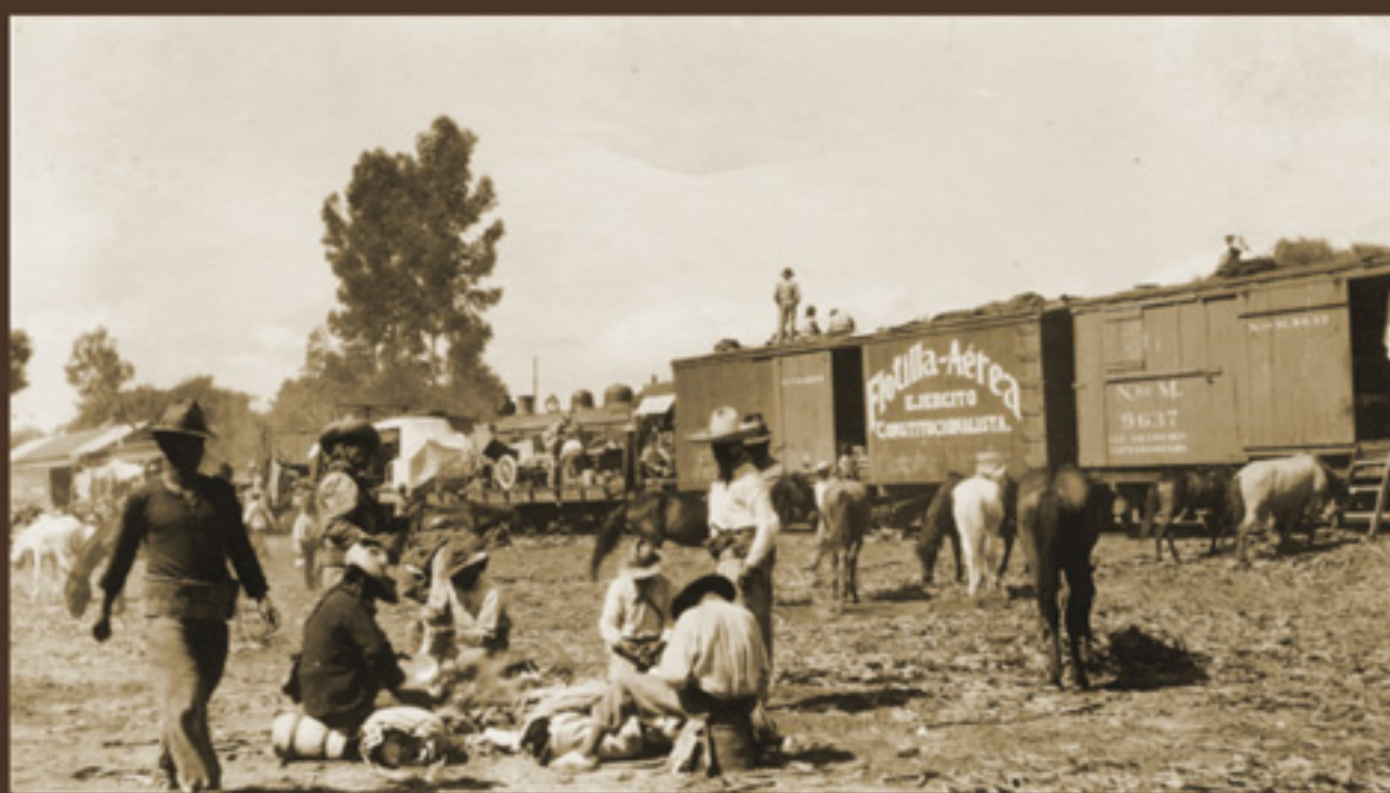
Tren de la Flotilla aérea del Ejército Constitucionalista. ca. 1916