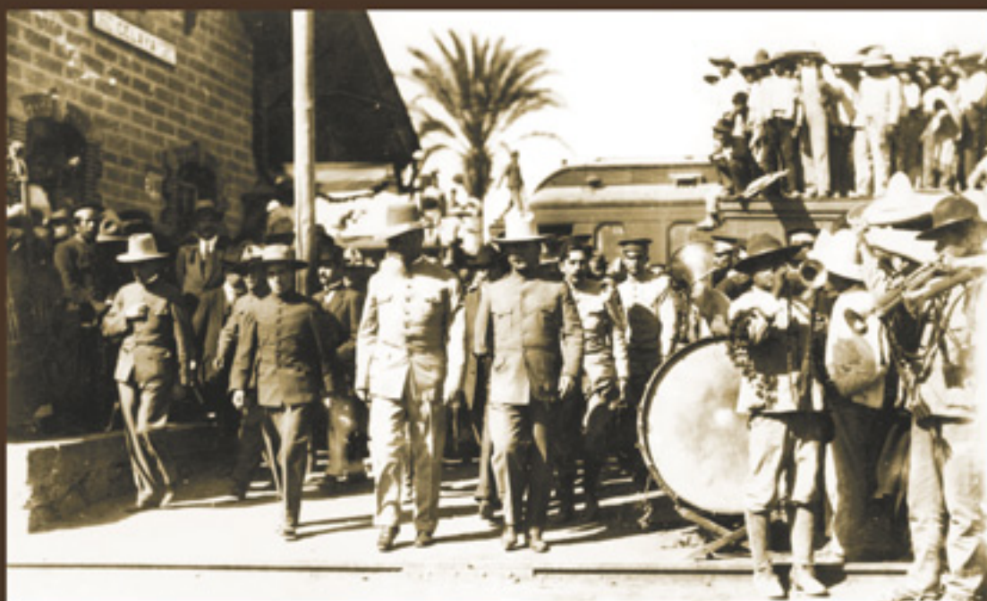
Llegada del Primer Jefe, Venustiano Carranza, y el general Álvaro Obregón a la estación del Ferrocarril de la ciudad de Celaya, Gto., enero de 1916, Fototeca Nacional INAH.

Periódico El Pueblo , 8 de abril de 1915.