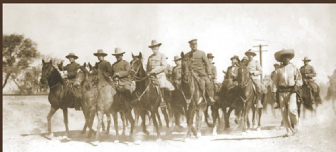
Venustiano Carranza y el general Álvaro Obregón recorriendo los campos donde se desarrolló la batalla de Celaya, enero de 1916

Cerca de los terrenos de la refinería “La Internacional” el Primer Jefe colocó la primera piedra de un monumento para recordar a todos los patriotas que “gloriosamente” sucumbieron en tan importantes hechos de armas. En la misma ceremonia, el general Obregón recibió como obsequio una medalla de oro que tenía la siguiente inscripción: “La ciudad de Celaya, a su invicto Libertador, el General A. Obregón, Abril 7 y 15 de 1915”.