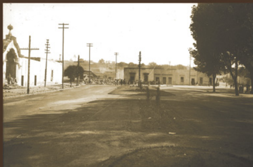
Paseo Colón, Querétaro, Qro., ca. 1914

Unas semanas después, el 3 de febrero, Carranza emitió un Decreto declarando a Querétaro capital de la República. La decisión se basaba no solamente en que se trataba del centro geográfico del país, sino a que reunía las condiciones de paz y tranquilidad para que los miembros del gobierno organizaran debidamente la administración pública antes del restablecimiento del orden constitucional. La ciudad de México seguiría siendo el Distrito Federal.