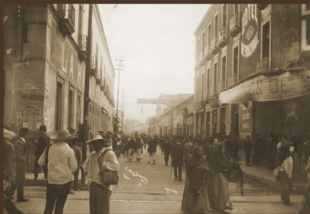
Calle Juárez, Querétaro, Qro., ca. 1916, Fondo Washington, Acervo Histórico Diplomático, Secretaría de Relaciones Exteriores.

Venustiano Carranza, Querétaro, Qro., 5 de enero de 1916.