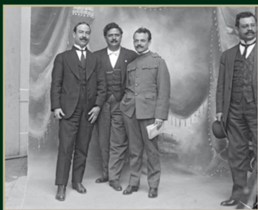
Los diputados Hilario Medina, Heriberto Jara y Francisco J. Múgica, los dos últimos integrantes del grupo radical o "jacobinos" del Congreso Constituyente, 1916. Número de inventario: 39675.

Manifiesto a la Nación de 94 diputados jacobinos, 31 de enero de 1916.