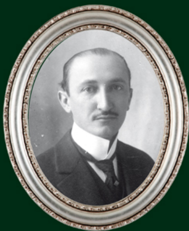
Félix F. Palavicini

Gerzayn Ugarte, discurso en la última sesión del Congreso Constituyente, 31 de enero de 1917.