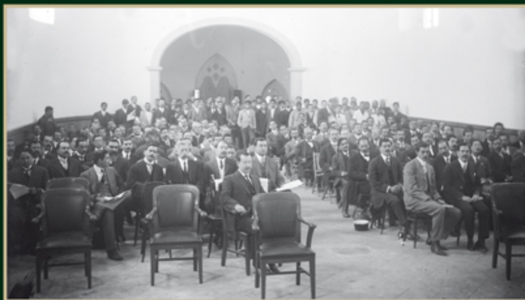
Aspecto del Salón durante la Primera Sesión del Congreso Constituyente, 21 noviembre de 1916.

En el Congreso Constituyente hubo representación de 29 entidades federativas, dado que en Campeche se eligieron dos constituyentes pero no se presentaron, y Quintana Roo no tuvo representantes. De los 219 diputados constituyentes, 59 fueron abogados, 33 militares, 21 médicos, 18 ingenieros, 15 profesores, ocho periodistas, ocho campesinos, seis comerciantes, cuatro obreros y 12 con distintas ocupaciones. De 35 no se cuenta con información de su profesión u oficio.