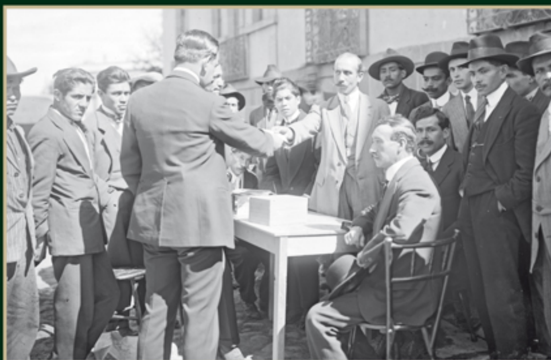
Casilla electoral durante las elecciones de octubre de 1916. Sinafo-INAH. Secretaría de Cultura. Número de inventario: 40582.

Una vez emitida la convocatoria a elecciones comenzaron las reuniones de los grupos afines para seleccionar a los candidatos que participarían en los comicios y presentar sus propuestas políticas.