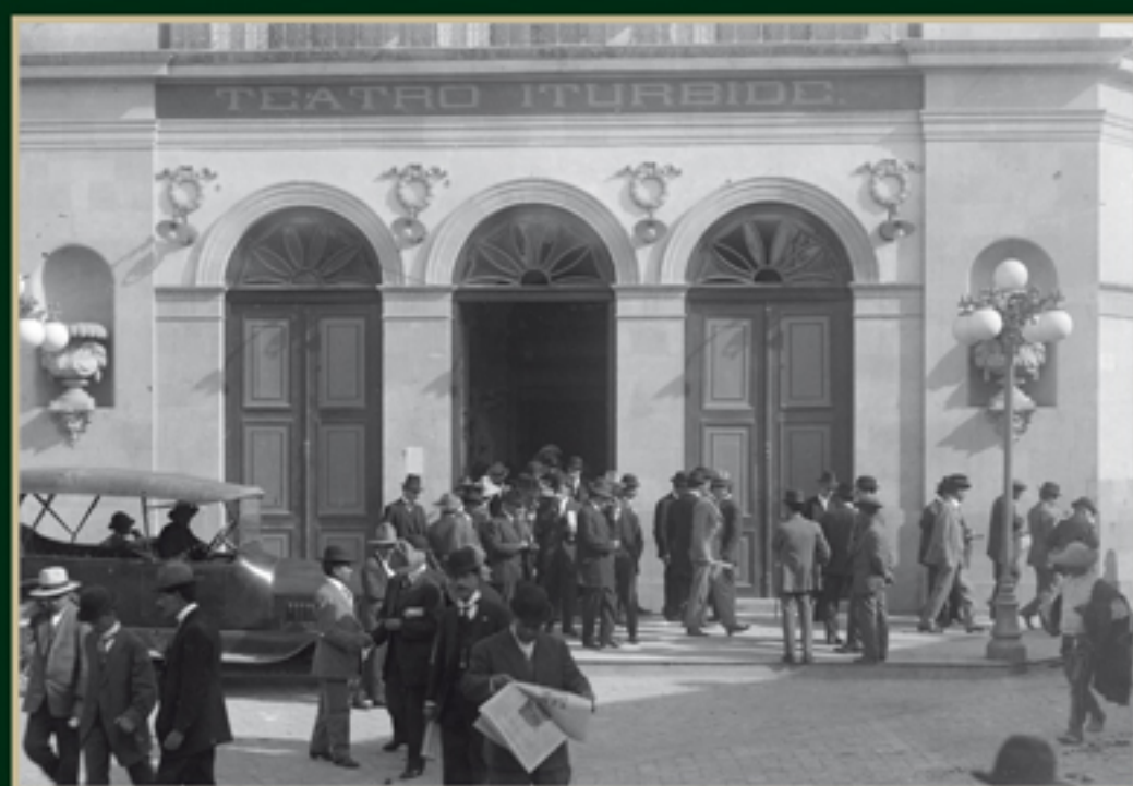
Un grupo de diputados constituyentes saliendo de una sesión, diciembre de 1916. Número de inventario: 5003.

En su proyecto, señaló que lo primero era garantizar las libertades individuales; propuso reformar al sistema judicial, acabar con los monopolios, expedir leyes laborales, el sufragio universal libre y directo, impulsar la educación, establecer la libertad municipal, eliminar la facultad del poder legislativo de juzgar al presidente de la República para establecer un Ejecutivo fuerte. Asimismo, se pronunció en contra del sistema parlamentario, ratificó la eliminación del vicepresidente y estableció la independencia absoluta del poder judicial.