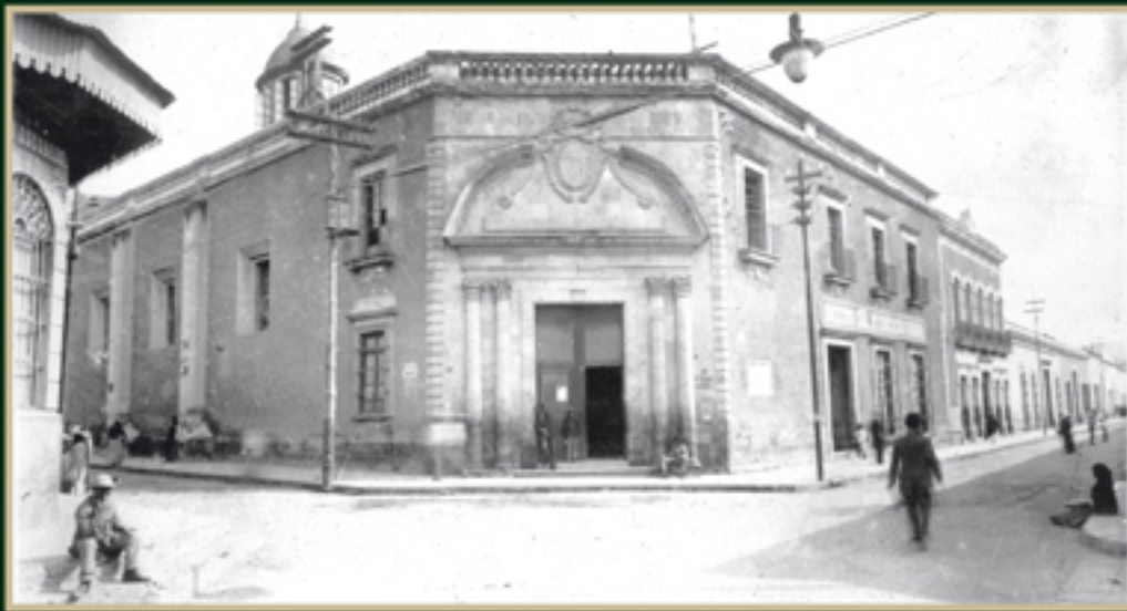
Academia de Bellas Artes de la ciudad de Querétaro, donde se celebraron las primeras sesiones del Congreso Constituyente, noviembre de 1916.

Ley Electoral, 19 de septiembre de 1916.