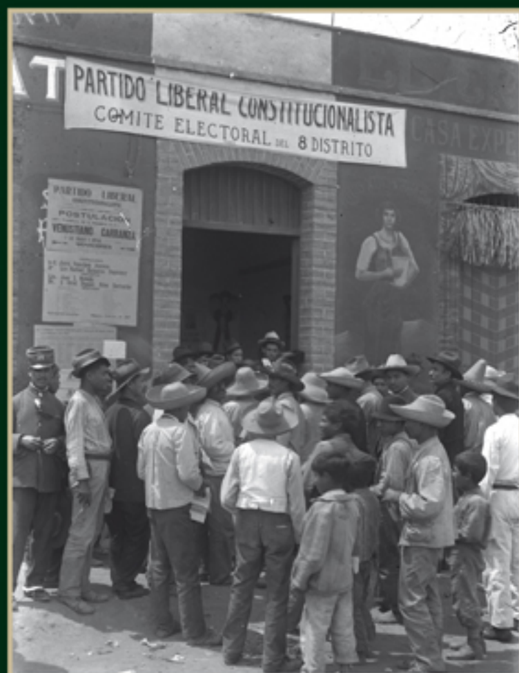
Comité Electoral del 8º Distrito del Partido Liberal Constitucionalista, ca. 1917. Sinafo-INAH. Secretaría de Cultura. Número de inventario: 5355.

También hubo algunos que no se presentaron al Congreso, por lo que sólo hubo una representación de 203 distritos. Finalmente, fueron 219 los diputados constituyentes que estuvieron en ejercicio, de los cuales 209 son los que se presentaron a firmar la Constitución.