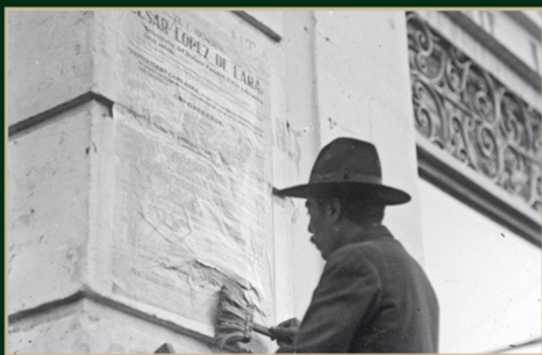
Monumento en el que es fijado el bando que convoca a las elecciones de diputados del Congreso Constituyente, septiembre de 1916. Sinafo-INAH. Secretaría de Cultura. 41293.

Venustiano Carranza, Modificaciones al Plan de Guadalupe, 14 de septiembre de 1916.