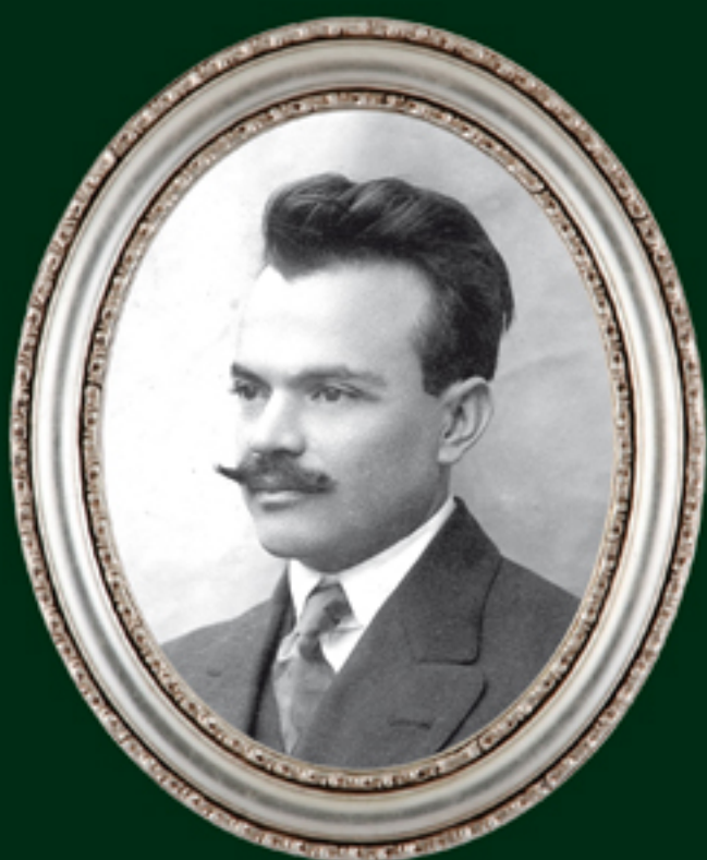
Francisco J. Múgica

Discusión sobre el artículo 27, sesión del 29 de enero de 1917.