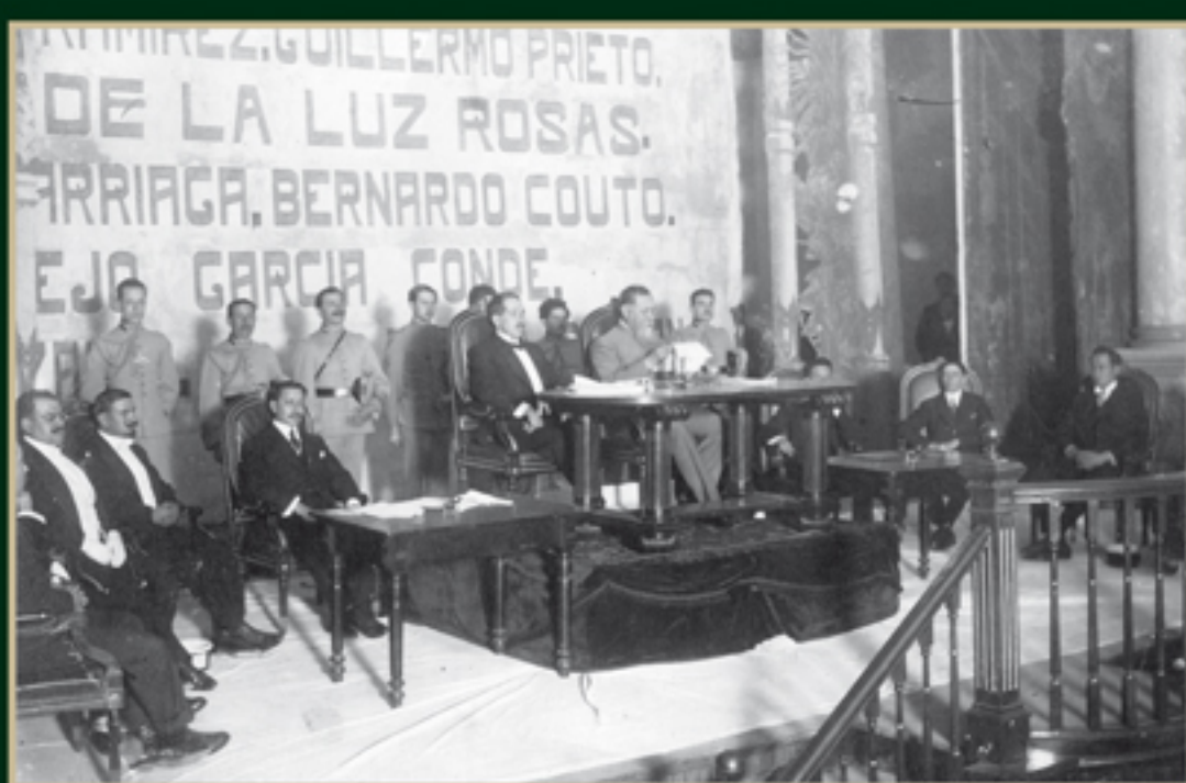
El Primer Jefe Venustiano Carranza leyendo un discurso al inaugurar las sesiones del Constituyente, 1º de diciembre de 1916.

Venustiano Carranza, discurso inaugural, 1º de diciembre de 1916.