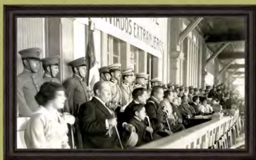
Anónimo, El presidente Venustiano Carranza presenciando los juegos florales en la Ciudad de México junto al cuerpo diplomático acreditado en México, 1917. Plata sobre gelatina. Colección Ruth Becerra Velázquez, INEHRM.

México ejerció un importante liderazgo entre los países neutrales con una iniciativa de paz que buscaba terminar el conflicto bélico a través de un boicot comercial de los países neutrales a los países beligerantes. Esta iniciativa fue bien recibida por los países latinoamericanos, pero no pudo concretarse ante el ingreso de Estados Unidos a la guerra. A pesar de ello, Carranza fortaleció los lazos de amistad y cooperación con los países latinoamericanos.