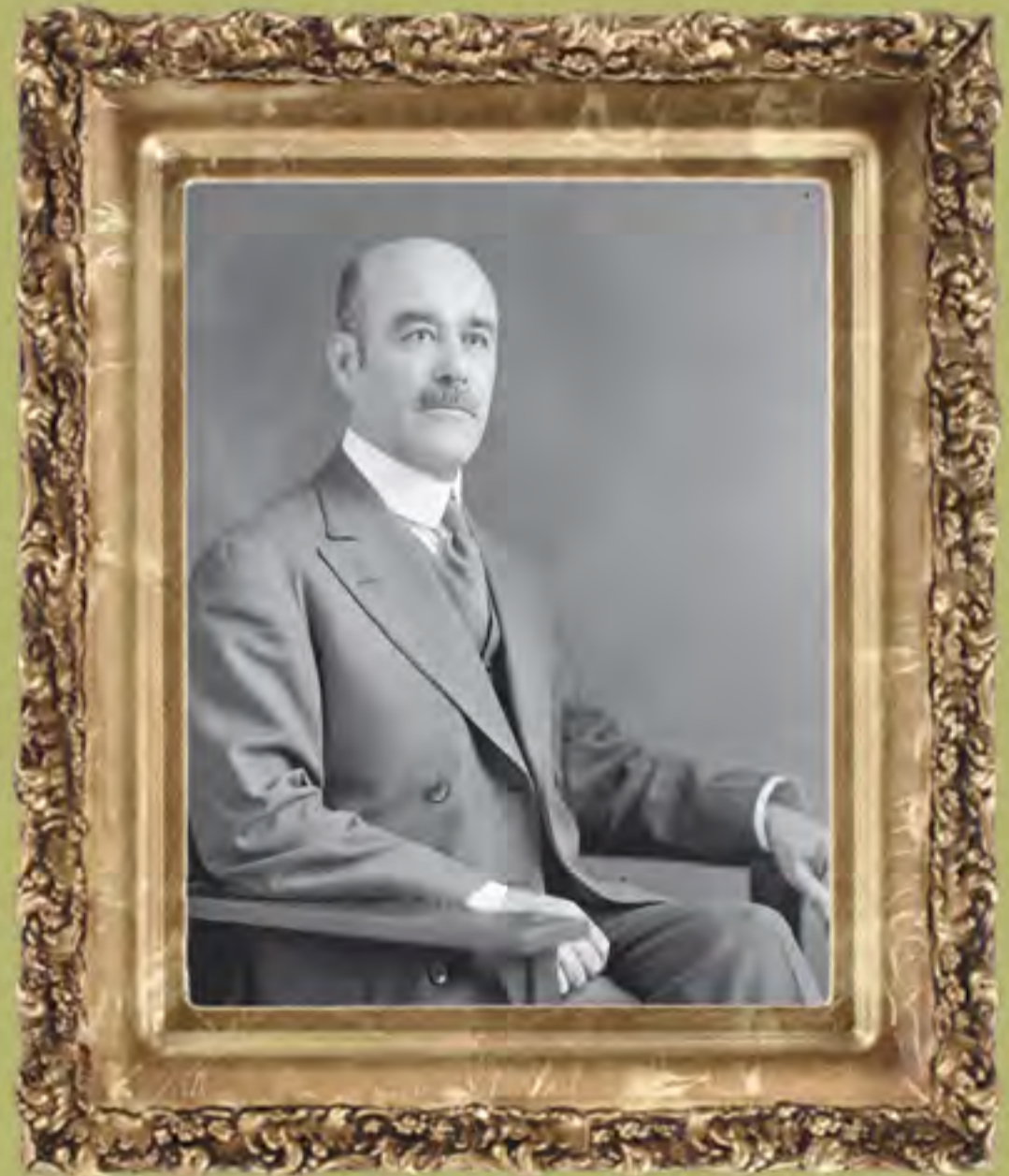
Embajador de México en Estados Unidos, Ignacio Bonillas, 1919, candidato presidencial en 1920.

El presidente Carranza emitió un manifiesto el 15 de enero de 1919, en el que pidió que tuvieran calma, que faltaba mucho tiempo para las elecciones y reiteró su compromiso de garantizar elecciones libres y equitativas. Expresó que un prolongado periodo de efervescencia política, en un país como México que no tenía experiencia democrática, causarían serios peligros para la consolidación de la obra revolucionaria. Manifestó que las campañas políticas debían ser breves, pues la Revolución no estaba consolidada y sus enemigos aprovecharían para luchar contra el gobierno.