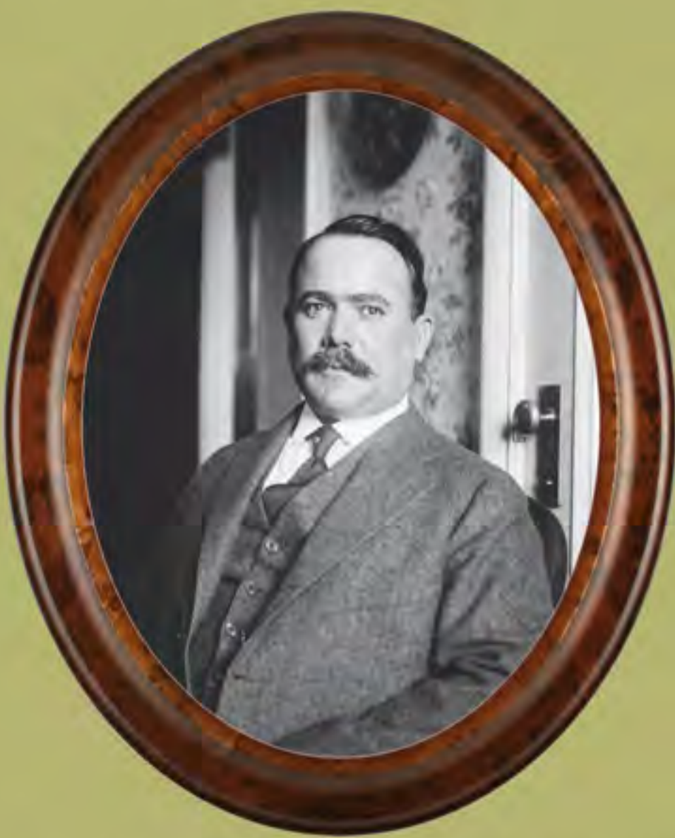
General Álvaro Obregón, candidato presidencial en 1920.

Sin embargo, los aspirantes a sucederlo no atendieron su llamado. Obregón emitió un manifiesto el 10 de junio de 1919 con el que inició su campaña presidencial. El general invicto de la Revolución señaló que los logros de ésta estaban en peligro si no se respetaba la voluntad popular en las elecciones. Reivindicó ser parte del Partido Liberal y alertó sobre el riesgo de que un conservador llegara a la Presidencia con el apoyo de los generales beneficiados por la Revolución.