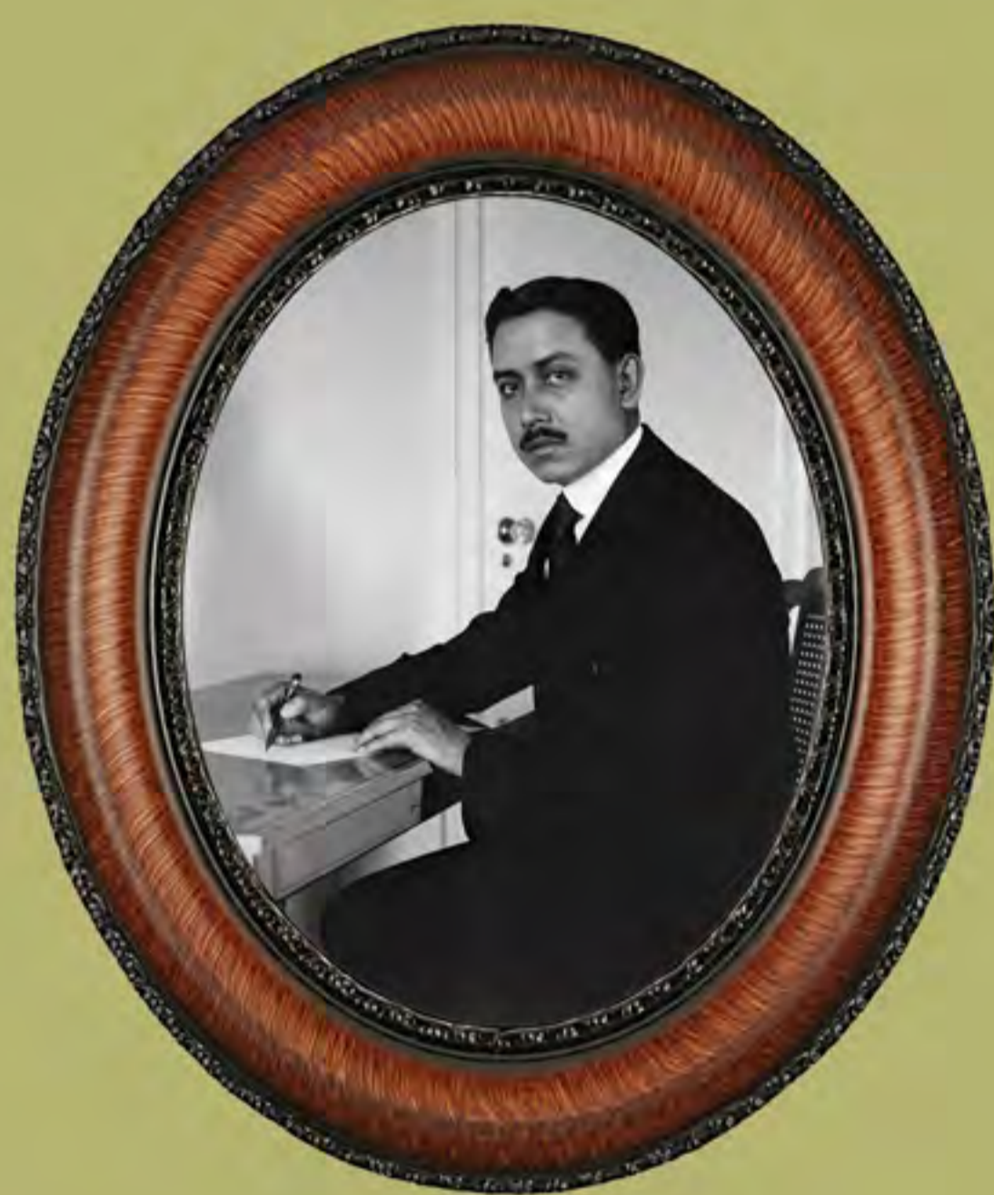
General Cándido Aguilar, ca. 1917. Biblioteca del Congreso de Estados Unidos.

Primer Informe de Gobierno de Venustiano Carranza, 1o. de septiembre de 1917.