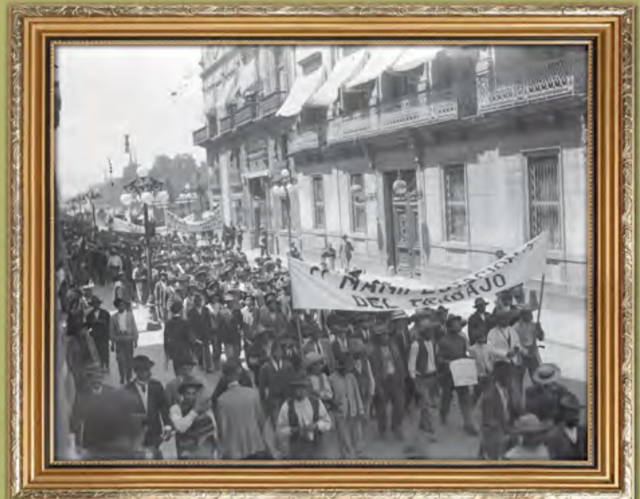
Mitin de trabajadores en la avenida Madero, ca. 1917

Carranza inició la reactivación de la economía nacional devastada por la Revolución. Para ello creó la Secretaría de Industria y Comercio, que comenzó sus labores en abril de 1917 y a la que un año después se le agregó la materia del Trabajo. Su gobierno revisó las concesiones otorgadas a las compañías mineras y petroleras lesivas para la nación. Se otorgó otras nuevas acordes con el artículo 27 constitucional. La minería se recuperó notablemente: en 1919 había 3 783 compañías mineras funcionando; la producción en 1919 fue de 350 millones de pesos, y la de plata llegó casi al nivel de 1910.