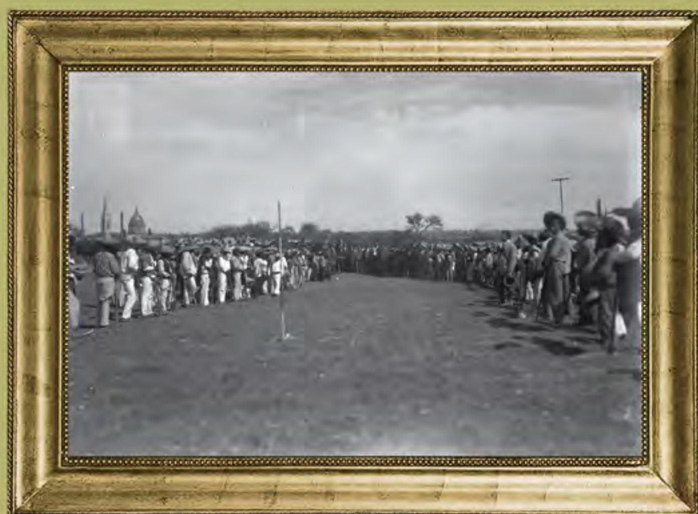
Campesinos y funcionarios durante reparto agrario, 1917.

4º: Se protegió a los bosques, evitando la tala inmoderada de los montes tanto de empresas particulares como de la población.