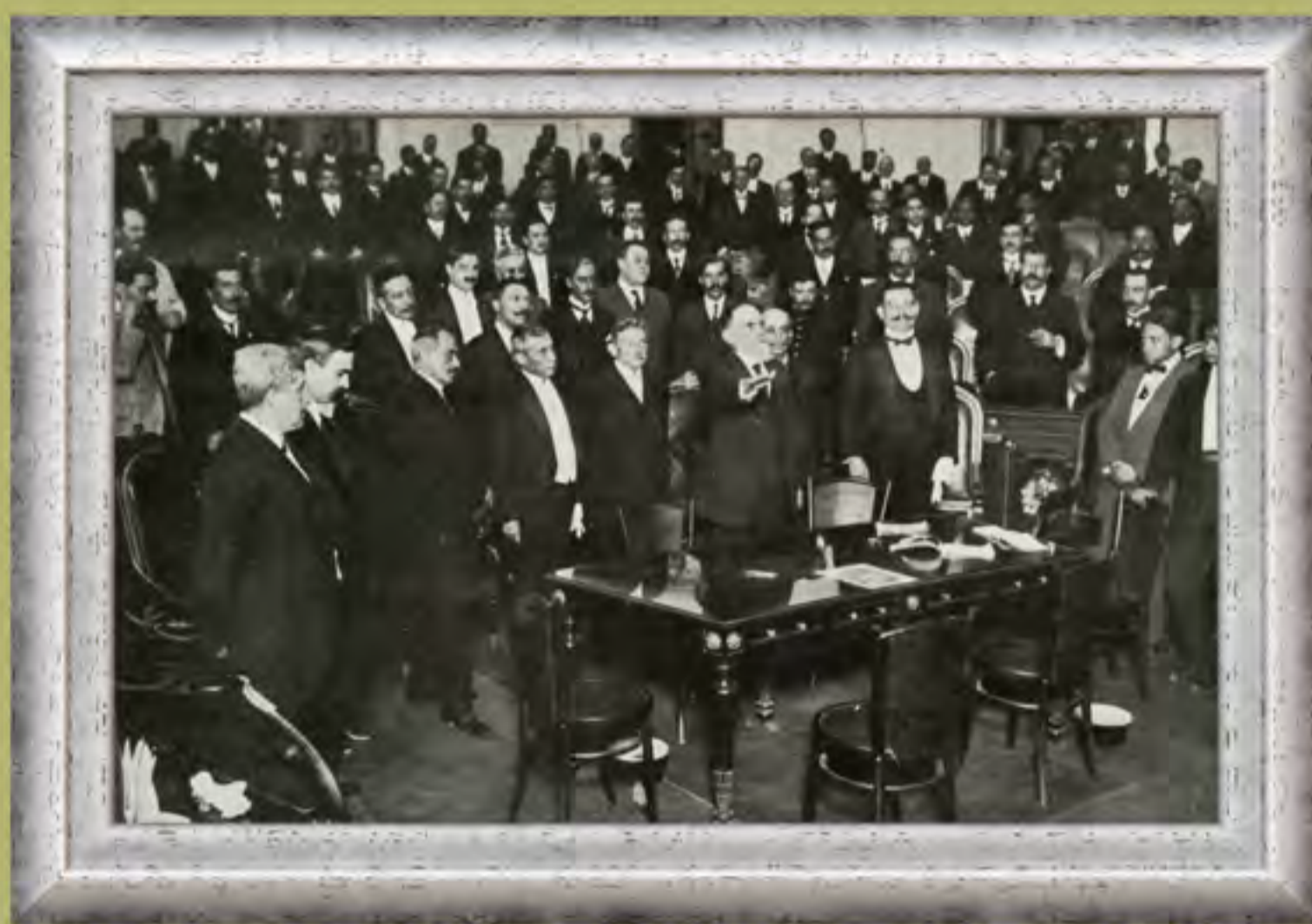
Los ministros de la Suprema Corte de Justicia de la Nación, en los momentos de otorgar la protesta ante el Congreso de la Unión, el 1o. de junio de 1917. Fotomecánico.

Primer Informe de Gobierno de Venustiano Carranza, 1o. de septiembre de 1917.