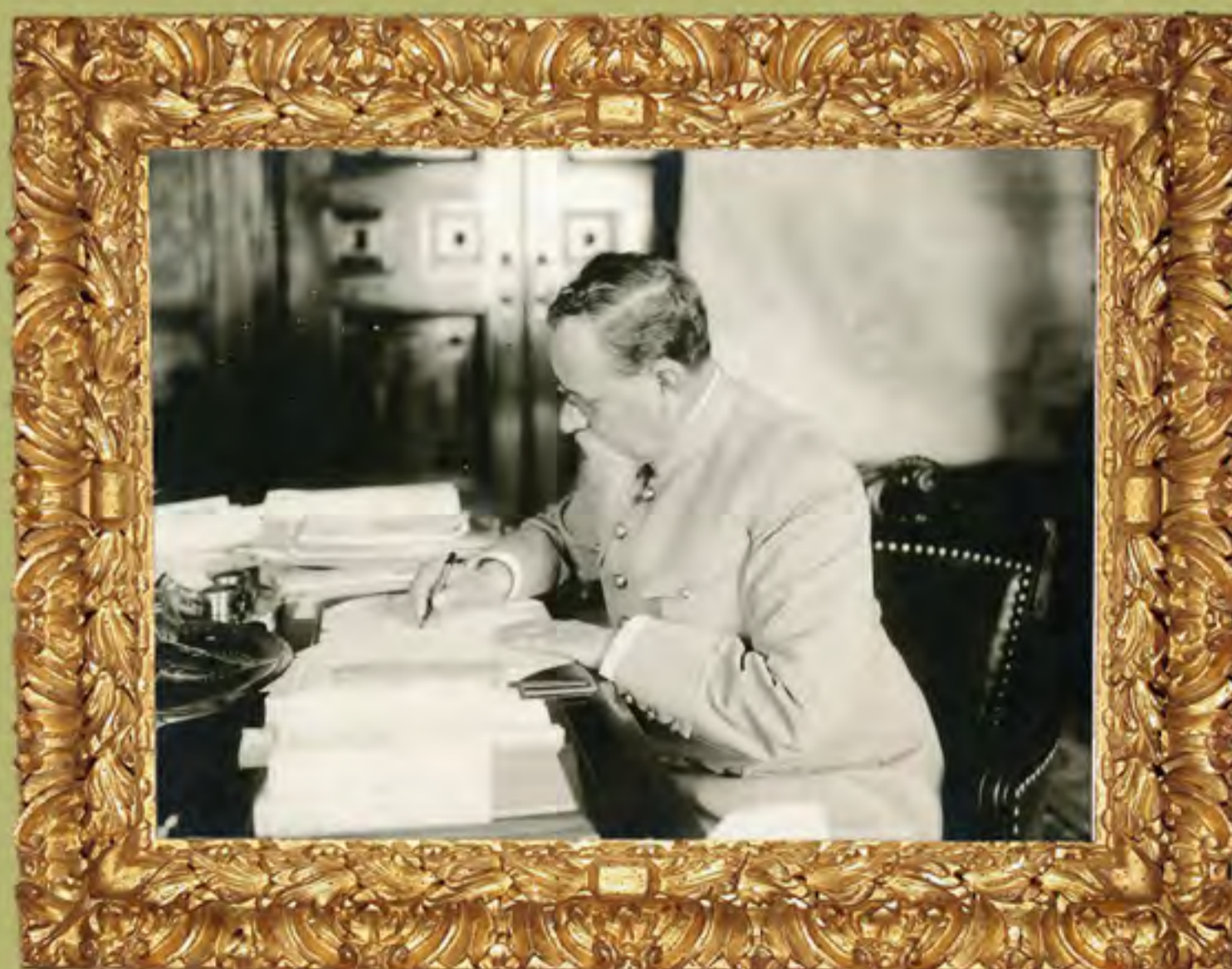
Venustiano Carranza firmando su último documento como Primer Jefe del Ejército Constitucionalista. 30 de abril de 1917. Plata sobre gelatina.