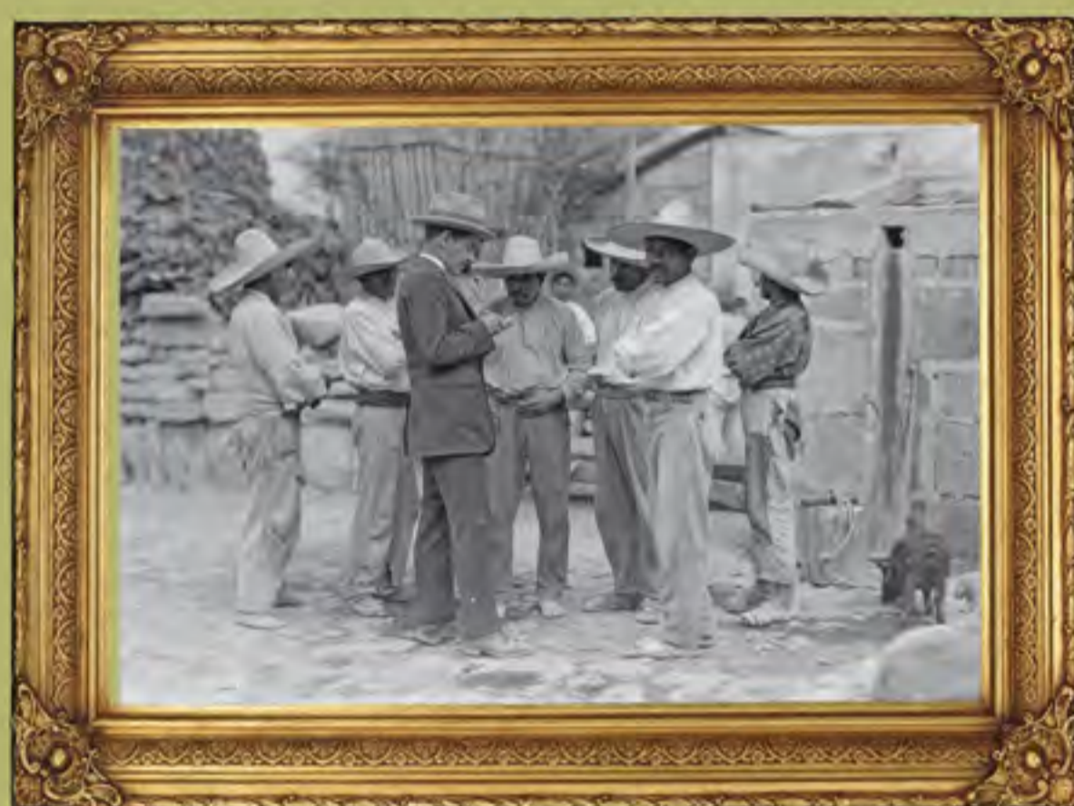
Campesinos entorno a un hombre que hace anotaciones, al parecer un censo, 1917. Secretaría de Cultura. INAH.SINAFO.FN.MÉXICO.

Tercer Informe de Gobierno de Venustiano Carranza, 1o. de septiembre de 1919.