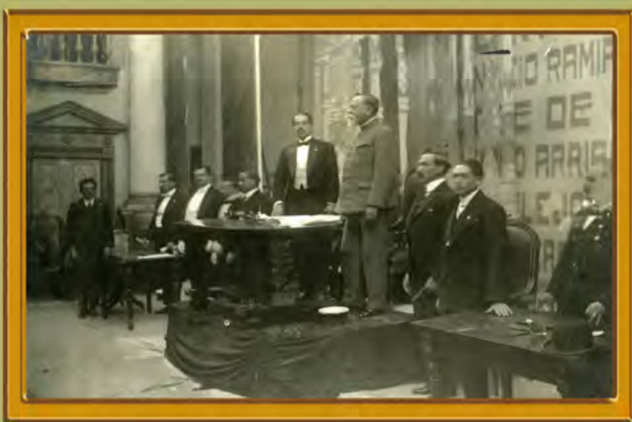
El Primer Jefe, Venustiano Carranza, protesta la nueva Constitución, 31 de enero de 1917. Plata sobre gelatina. Colección Ruth Becerra Velázquez.

El presidente Carranza escribió también algunas de las páginas más brillantes en la historia de la diplomacia mexicana. Enfrentó con éxito dos invasiones armadas de Estados Unidos, en Veracruz en 1914, y en Chihuahua, en 1916. Con firmeza, defendió la soberanía nacional, evitó una guerra con Estados Unidos y consiguió el retiro de las fuerzas invasoras. Pudo mantener la neutralidad de México ante la Primera Guerra Mundial, sin ceder a las presiones de Estados Unidos e Inglaterra y dio a México una posición de liderazgo internacional con su postura en favor de la paz.