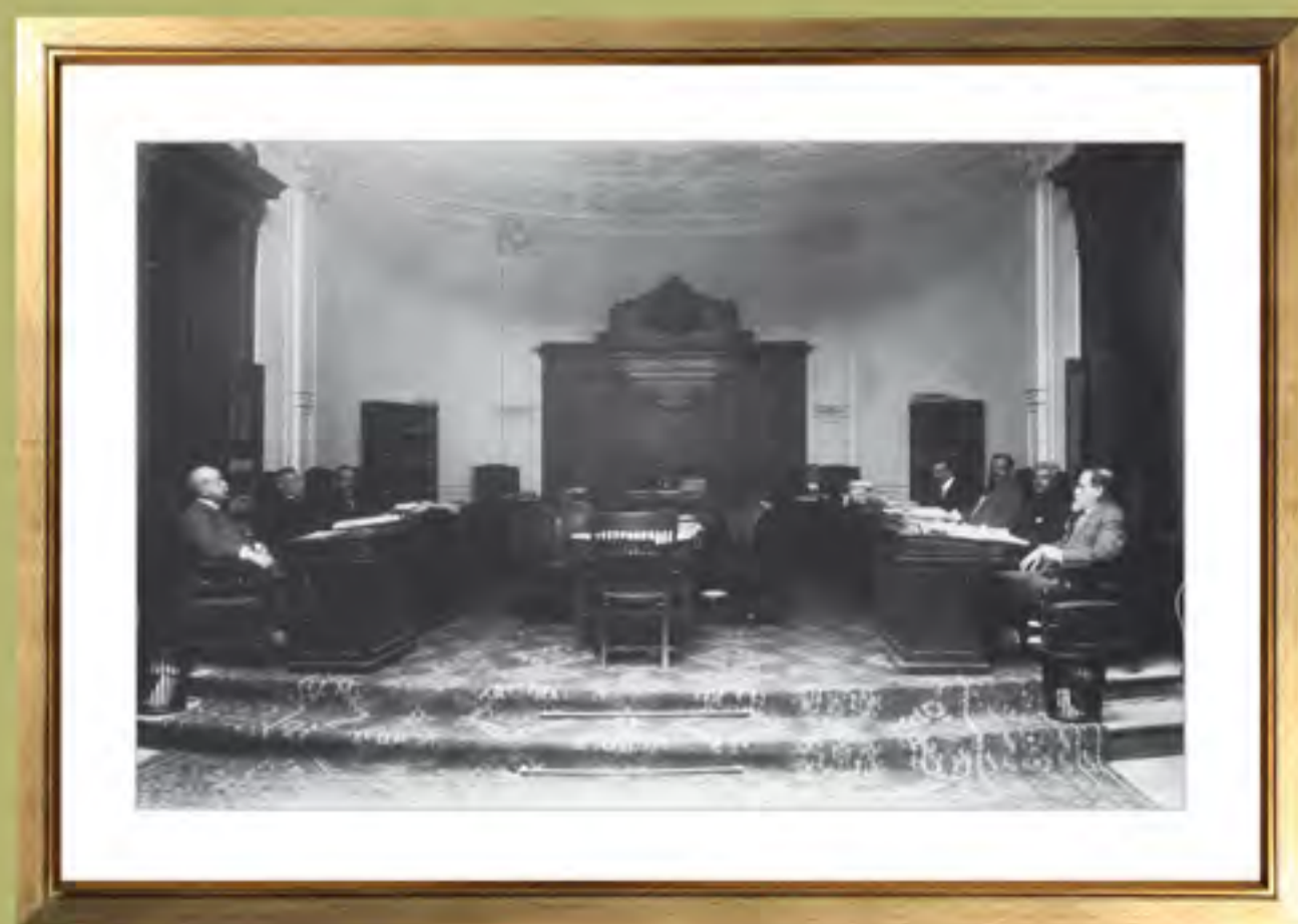
Sala principal de la Suprema Corte de Justicia, 1917.

Durante el gobierno de Carranza, la actuación de la Suprema Corte dio atención a las múltiples demandas de amparo promovidas por empresas, hacendados y particulares en contra de lo dispuesto por los artículos 27 y 123. El Ejecutivo, a través de la Comisión Agraria, defendió las resoluciones de dotación de tierras y respetó los fallos de la Corte en los casos que se justificaron los amparos.