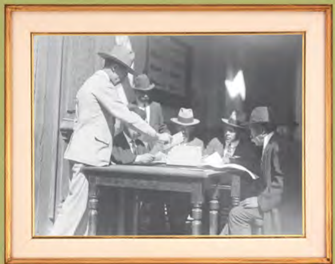
Hombre deposita su voto en una casilla electoral. 1917.

El gobierno continuó con el proceso de pacificación del país. Combatió las rebeliones de Villa,