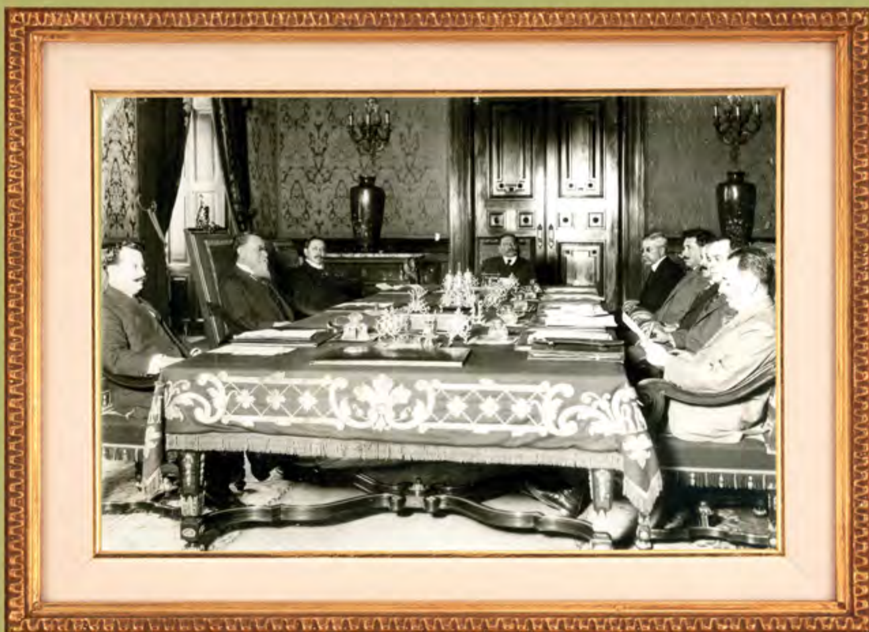
El presidente Venustiano Carranza en Consejo de Ministros, jueves 6 de mayo de 1918. Plata sobre gelatina.

Venustiano Carranza inició también la elaboración de las leyes reglamentarias de los artículos 27 y 123 para la organización del gobierno federal, del Poder Judicial y de las relaciones familiares. Además, promovió la organización de congresos de comerciantes e industriales para reorganizar el comercio y la industria, y así garantizar el abasto de productos básicos.