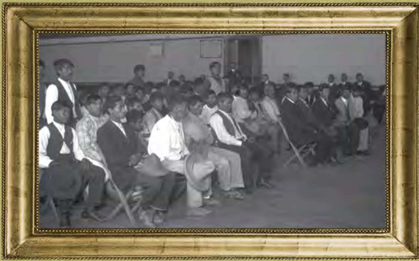
Asamblea de trabajadores de la Tabacalera Mexicana, S.A., ca. 1917

Tercer Informe de Gobierno de Venustiano Carranza, 1o. de septiembre de 1919.