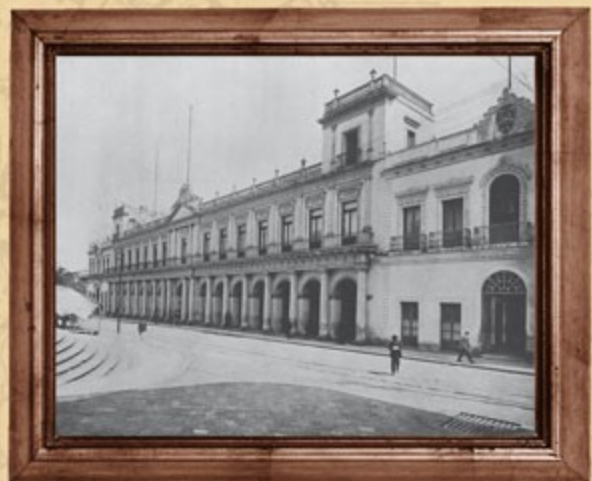
Palacio de Gobierno de Jalapa, Veracruz, ca. 1915.

El texto original se integra de 141 artículos, distribuidos en nueve títulos. Se destaca como uno de los requisitos para ser gobernador, diputado e integrante del ayuntamiento saber leer y escribir. También se incorpora la segunda vuelta electoral, al señalarse que en toda clase de elecciones bastará la simple mayoría para declarar electo al que la haya obtenido, con tal que contenga esa mayoría una cuarta parte, a lo menos, del total de los votos emitidos. Si ninguno obtuviere tal número de votos, se hará segunda elección sólo con los dos candidatos que hayan tenido el mayor número.