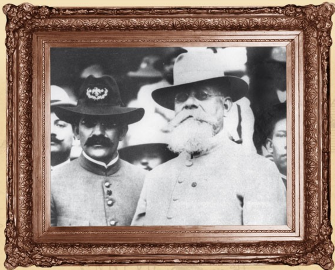
El Primer Jefe Venustiano Carranza y el general Pablo González, ca. 1917. Fotomecánico.

Estas ocho constituciones fueron las primeras promulgadas en 1917. Además de ellas se aprobaron también ese año las de Colima, Durango, Guerrero, Estado de México y Nuevo León. Con ello, fueron 13 las entidades en las que quedó restablecido plenamente el orden constitucional local.