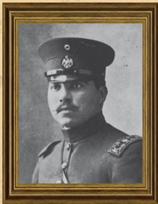
Joaquín Mucel, gobernador de Campeche, 1917. Fotomecánico.

El Constituyente de Campeche aprobó la Constitución el 30 de junio, siendo Enrique Arias Solís, diputado presidente. El 5 de julio siguiente, se promulgó la Constitución Política del Estado de Campeche, que reformó la del 30 de junio de 1861, siendo gobernador constitucional Joaquín Mucel. Entró en vigor ese mismo día.