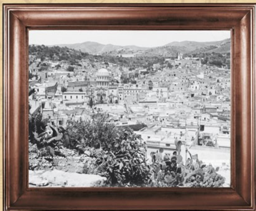
Guanajuato, ca. 1910.

El texto original se integra de 121 artículos, distribuidos en 10 títulos. Se destaca la obligación de contar con título o diploma oficial para ejercer las profesiones de abogado, médico cirujano, ingeniero civil y de minas, escribano público, farmacéutico, partera y cirujano dentista.