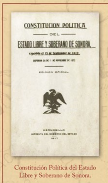
Constitución Política del Estado Libre y Soberano de Sonora.

Sonora fue uno de los estados donde tuvo mayor fuerza la revolución maderista. José María Maytorena asumió el gobierno constitucional en septiembre de 1911. Maytorena no reconoció al usurpador Huerta, pero pidió licencia al Congreso local, que eligió a Ignacio L. Pesqueira como sustituto.