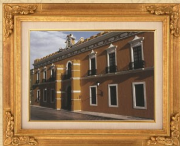
Palacio de Gobierno del estado de Campeche.

Campeche no tuvo diputación en el Congreso Constituyente de 1916-1917. El texto original se integra de 120 artículos, organizados en 16 capítulos. En ella se destaca que el Tribunal Superior de Justicia tiene la facultad de iniciar leyes sólo para corregir los vicios de la legislación civil y penal o para mejorar la de procedimientos judiciales.