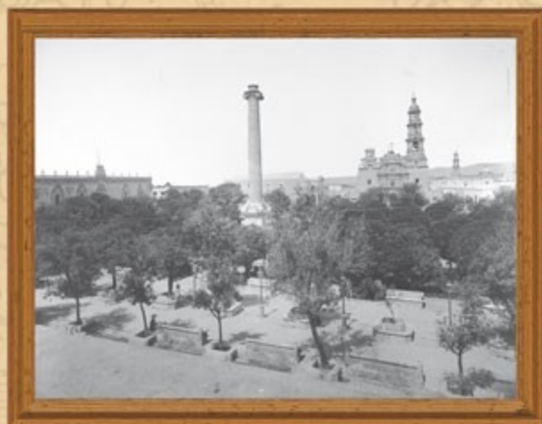
Vista de la ciudad de Aguascalientes.

El texto original se integra de 73 artículos, organizados en siete títulos. En ella se destaca que una vez pronunciada una sentencia condenatoria de reponsabilidad por delitos y faltas oficiales no puede concederse al reo la gracia de indulto.