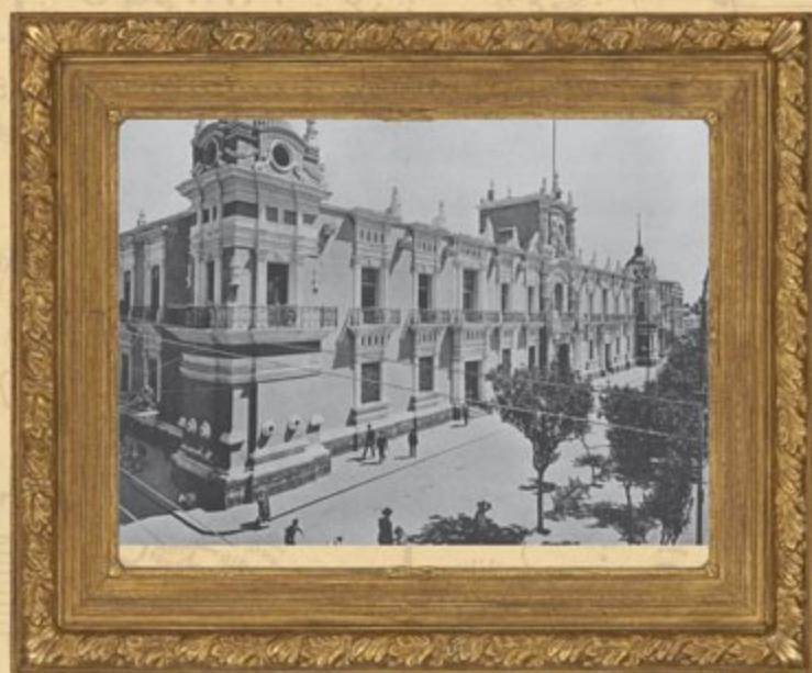
Palacio de Gobierno de Guadalajara, ca. 1910.

El texto original se integra de 67 artículos, distribuidos en siete títulos. En ella se resalta la obligación de los extranjeros de contribuir para los gastos públicos de la manera que dispongan las leyes; obedecer y respetar las instituciones, leyes y autoridades del estado, así como sujetarse a los fallos y sentencias de los tribunales, sin poder intentar otros recursos que los que se les conceden a los mexicanos.