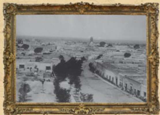
Vista panorámica de la ciudad de Querétaro, ca. 1910

El 2 de febrero de 1916, Carranza nombró a Querétaro capital provisional de la República. Su capital fue sede del Congreso Constituyente, donde Carranza promulgó la Constitución federal el 5 de febrero de 1917 y emitió la convocatoria a elecciones federales para el siguiente día. Ernesto Perusquía fue electo gobernador el 30 de junio de 1917.