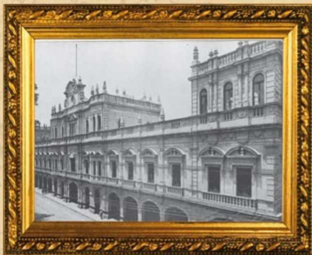
Palacio Municipal de Puebla.