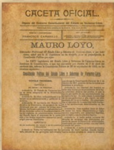
Constitución Política del Estado Libre y Soberano de Veracruz-Llave, en Gaceta Oficial, órgano del Gobierno Constitucional del Estado de Veracruz-Llave.

En Veracruz, la revolución maderista fue encabezada por Cándido Aguilar y Gabriel Gavira. Francisco Lagos Cházaro fue el gobernador maderista en 1912. Después del Cuartelazo, Cándido Aguilar defendió la causa constitucionalista y asumió el gobierno provisional en mayo de 1914, poco después de la ocupación estadounidense del puerto de Veracruz. En noviembre de ese año, Carranza instaló en Veracruz su gobierno provisional y desde ahí emitió la legislación preconstitucional.