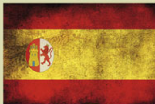
Bandera española, 1871-1873.