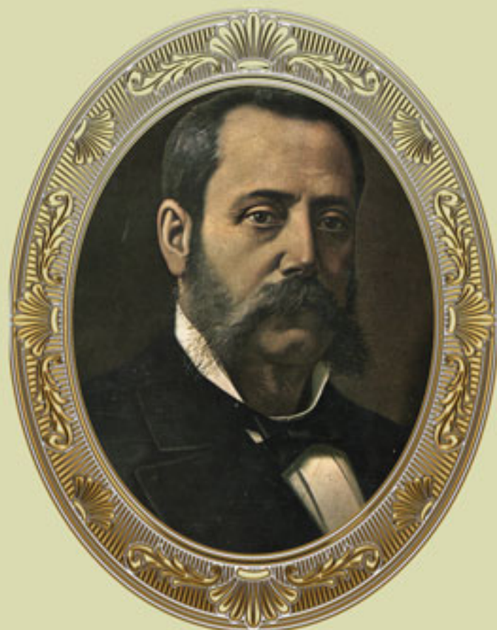
Gabino Barreda, óleo de Juan Cordero.

Ley Orgánica de la Instrucción pública en el Distrito Federal, 2 de diciembre de 1867.