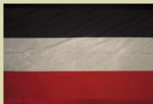
Bandera alemana, 1871.