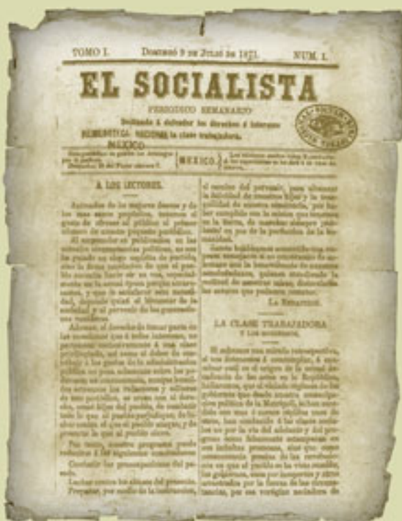
El Socialista, 9 de julio de 1871, Hemeroteca Nacional Digital.

Hacia 1870, la población nacional se aproximaba a los nueve millones de mexicanos, la mayoría establecidos en las zonas rurales y por ello marginados de las actividades políticas, culturales, educativas y económicas del país. Además, el número de habitantes resultaba muy reducido en relación con la extensión del territorio, lo que era un obstáculo para el desarrollo nacional.