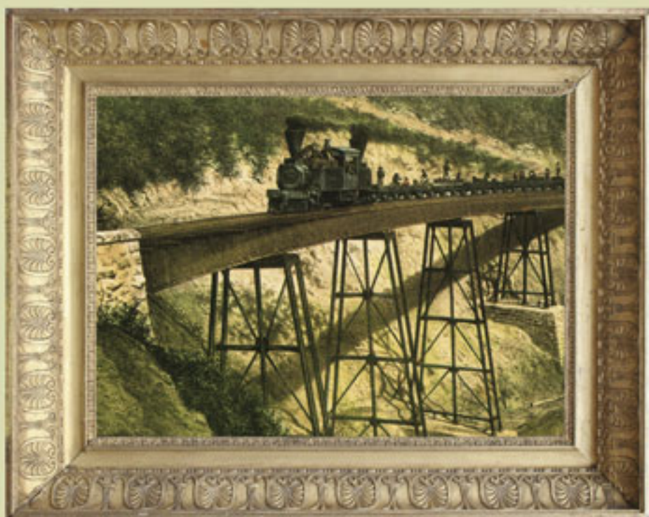
Ferrocarril mexicano, litografía de Casimiro Castro, impresa por H. Iriarte, México, 1868. Fotomecánico.

Las medidas adoptadas resolvieron muchos de los principales problemas, aunque resultaron insuficientes ante los elevados gastos de la pacificación.